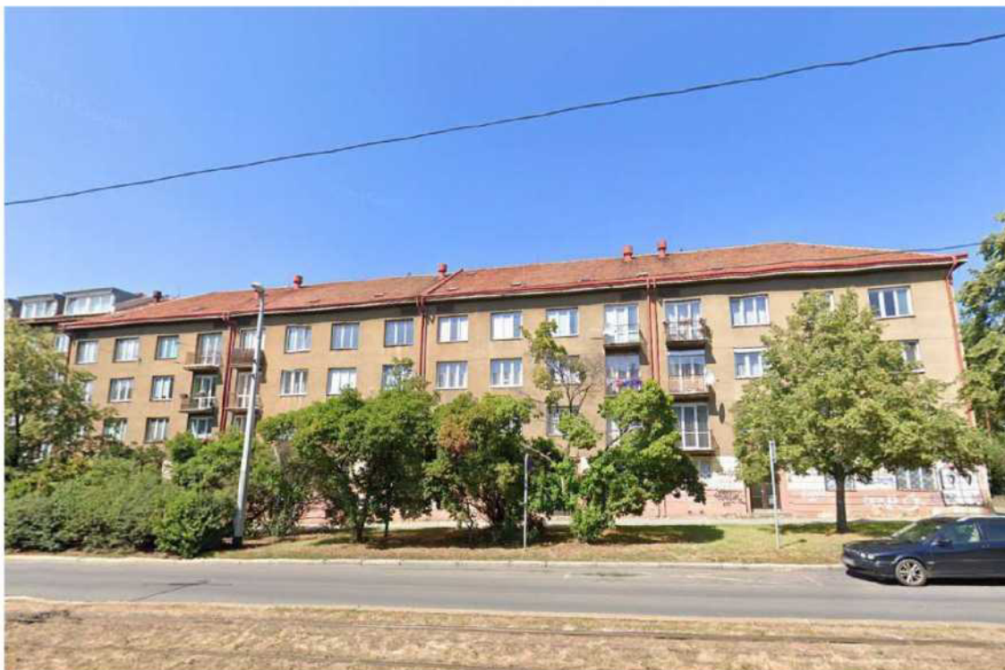
Pohled na č. p. 1827 - 1829 z ulice Průběžná