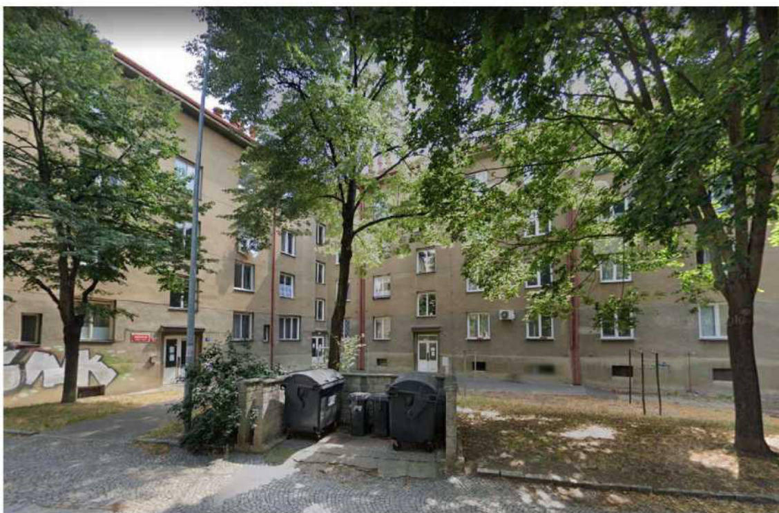
Pohled na č. p. 1830 a 1831 z ulice Nučická