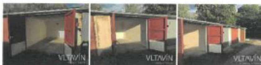
Prodej garáže 20 m 2 Křeslická, Praha 10 - Vršovice 395 000 Kč