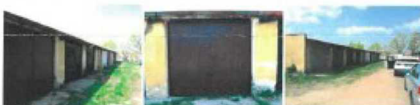
Prodej garáže 20 m 2 Křeslická, Praha - Vršovice 390 000 Kč