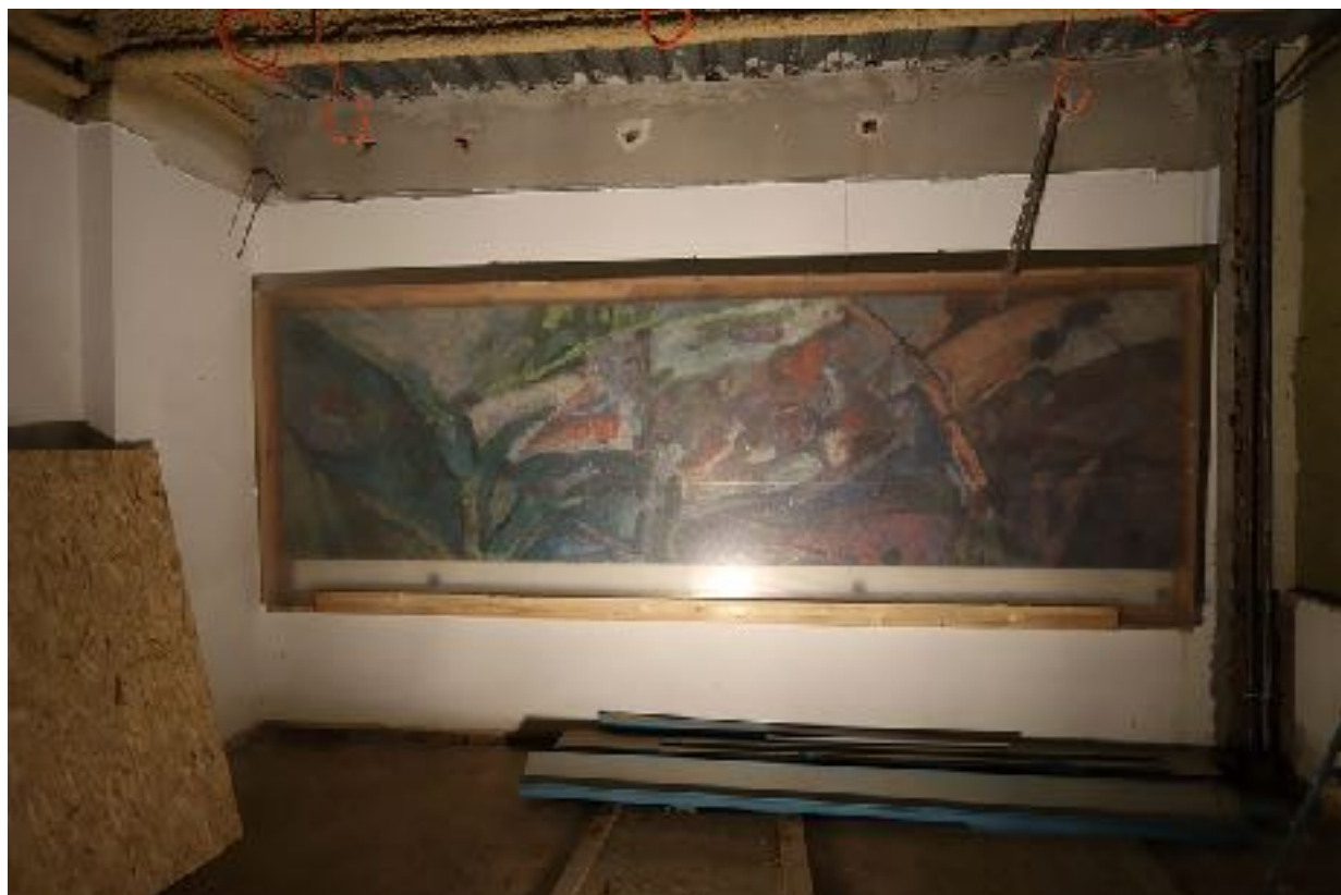
Celkový pohled na mozaikovou kompozici opatřenou ochranným bedněním - situace v době předběžného restaurátorského průzkumu 12/2020.