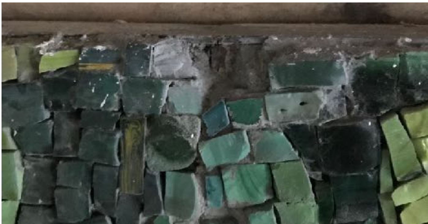
Detail dohotovené sondy - obnažený spoj dvou ocelových panelů L profilu.