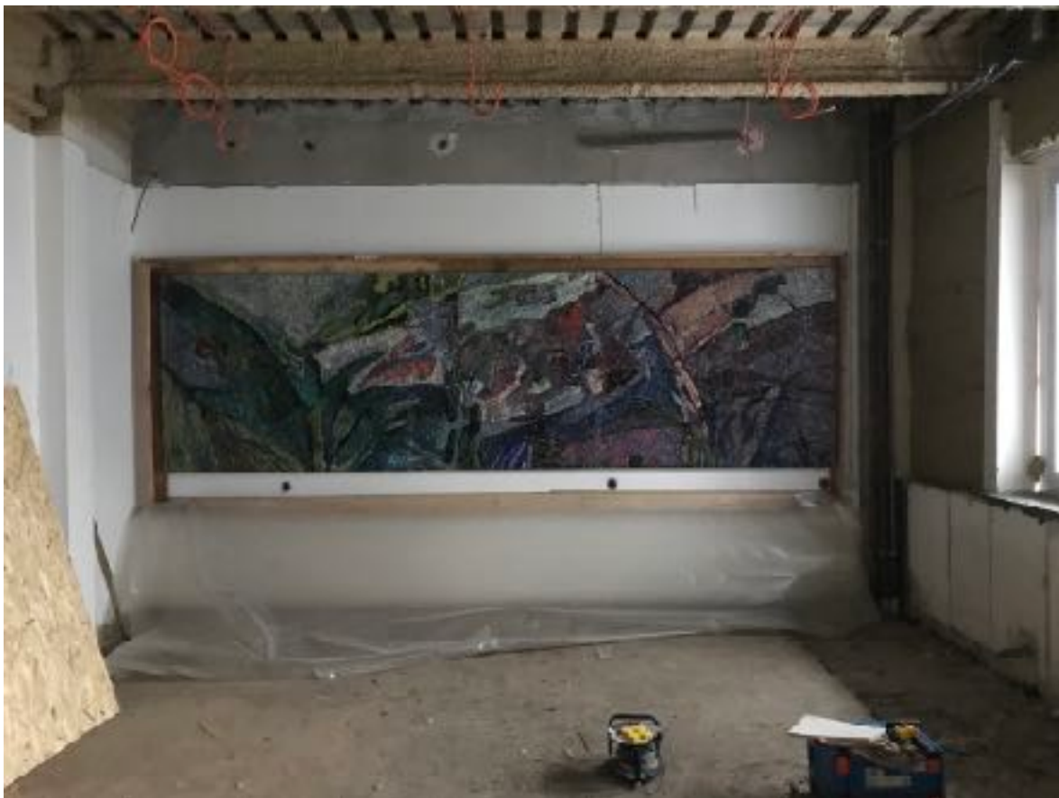
Celkový pohled na mozaikovou kompozici - situace během restaurátorského průzkumu. 1/2021.