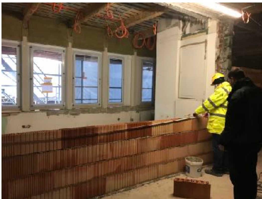
Definování prostoru nového místa osazení mozaiky - při vstupním vestibulu, v čekárně polikliniky.