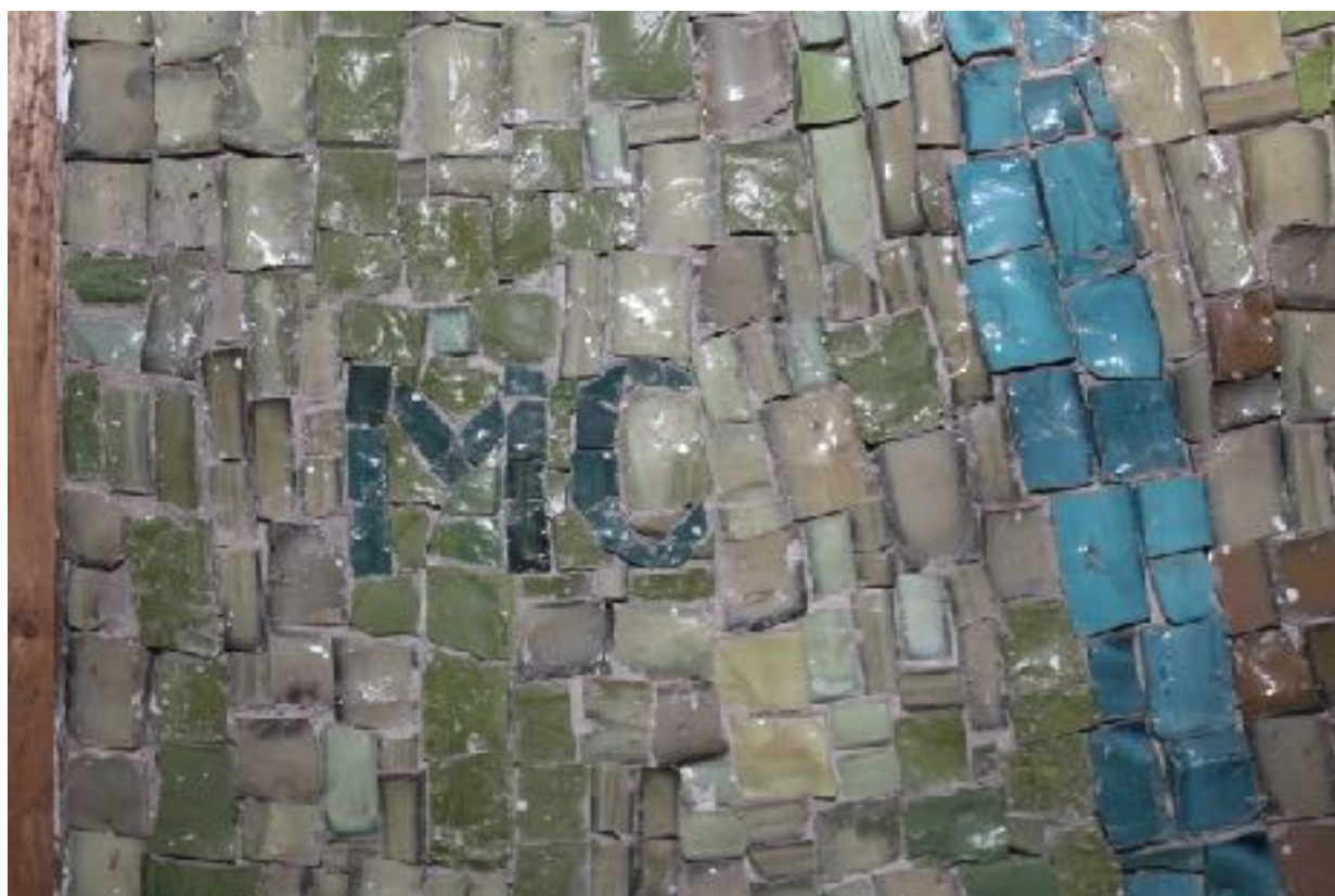
Detail levé části mozaiky se signaturou - iniciály MC.