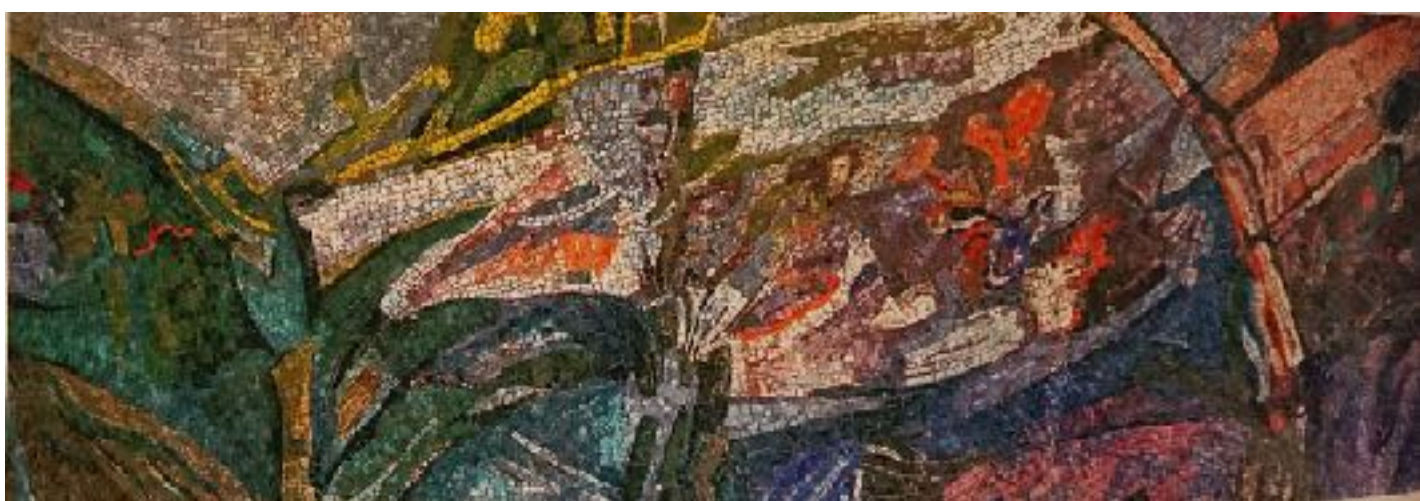
Celkový pohled na mozaikovou kompozici, foto: Petr Sirotek in Glass review , 1983, č. 6, s. 22.

Skleněná mozaika pro jídelnu polikliniky v Měšicích autor: M. Cubrová investor: Výstavba hl. m. Prahy - Výstavba účelových staveb Praha