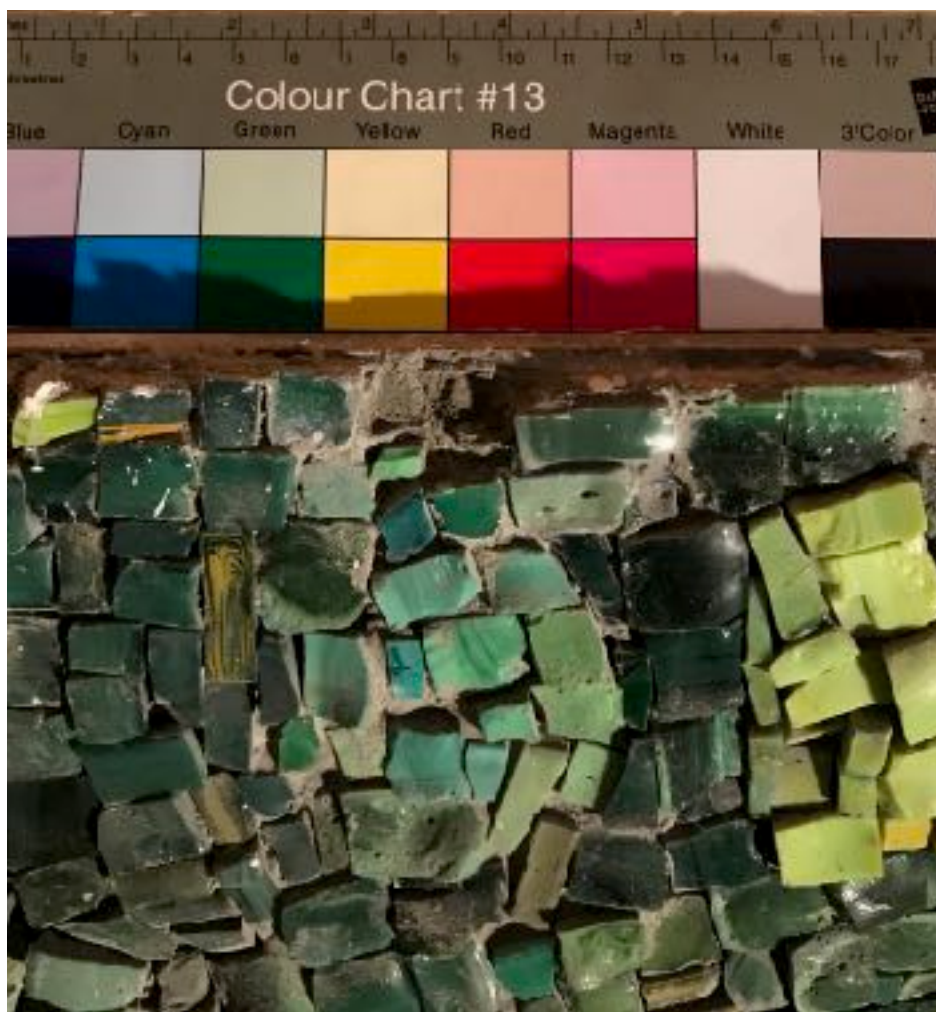
Detail horní části mozaiky, kde byla provedena sonda - v místě "švu" mezi 1. a 2. panelem mozaiky.