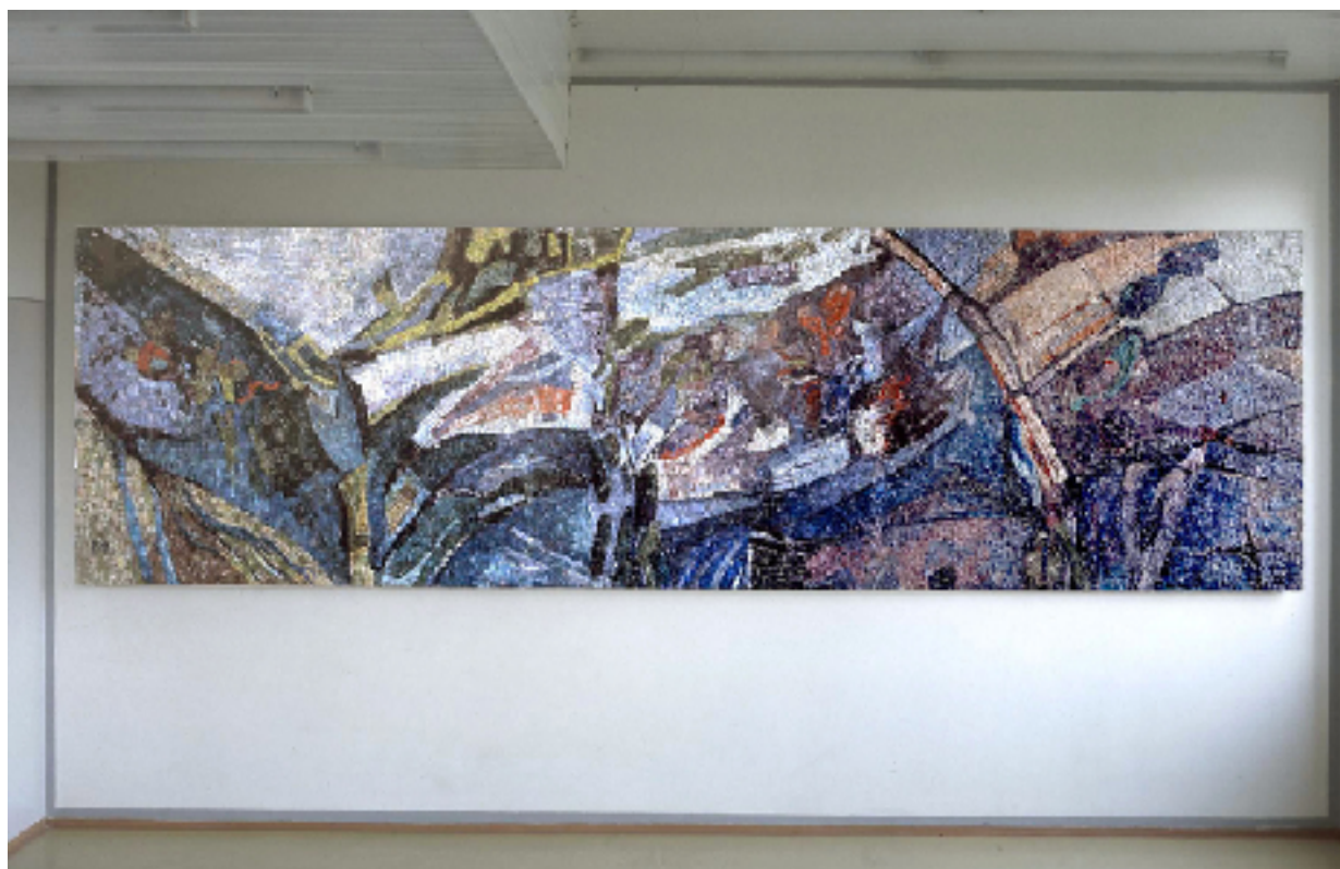
Celkový pohled na mozaiku - stav po instalaci v roce 1982.