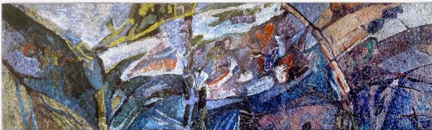
Celkový pohled na mozaiku - archiv autorky, foto A. Weisser.

Autoři fotografií: Magdalena Kracík Štorkánová, Ondřej Surový, A. Weisser, P. Sirotek Počet fotografií: 13