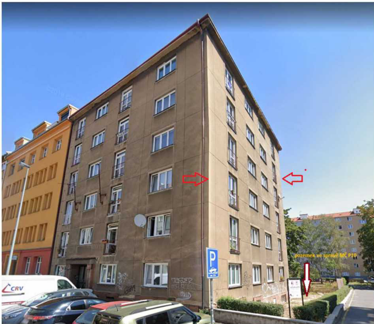
Pohled na nároží domu č. p. 1255 a boční zeď s budoucím přesahem zateplení nad pozemek parc. č. 1912/1, k. ú. Vršovice (ve správě MČ Praha 10) z ulice Oblouková.

Komise SOUHLASÍ s uzavřením Smlouvy o provedení stavby se Společenstvím vlastníků jednotek domu Oblouková 1255, Praha 10 s podmínkou, že společenství uhradí stanovenou částku 6.900,- Kč + DPH, která byla vypočtena dle zjištěné délky přesahu zateplení z programu Misys (katastrální mapa). Částka je určena následovně: 5.000,- Kč + 100 Kč za každý započatý metr délky + DPH (viz Příloha č. 6).