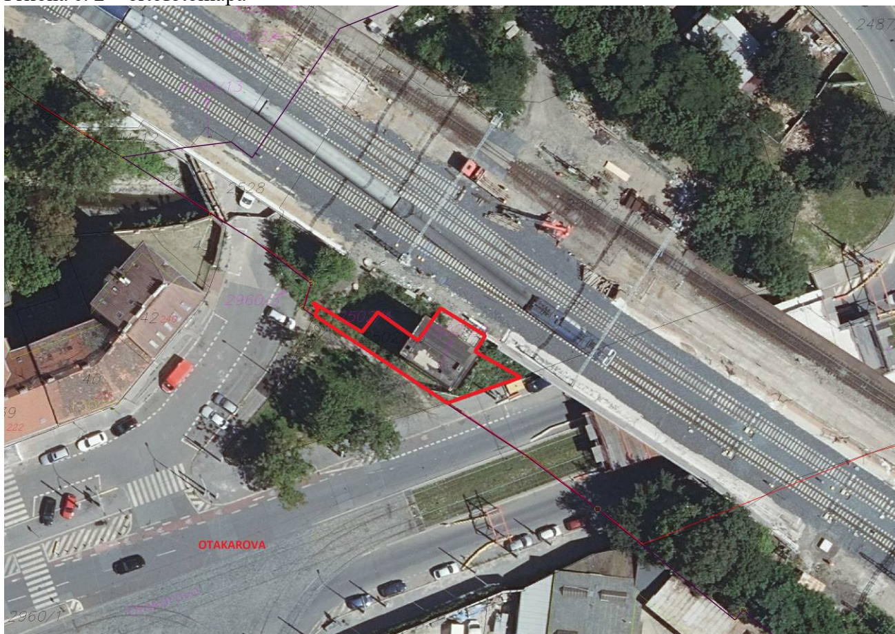
Příloha č. 3 – platný Územní plán