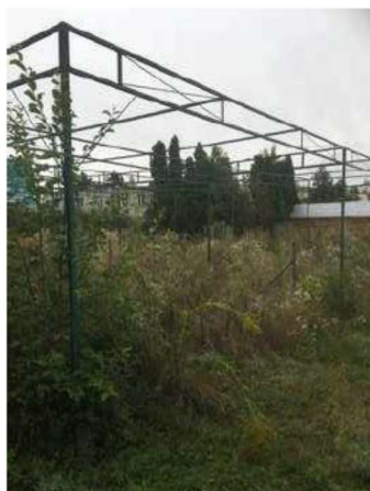
konstrukce k zastínění rostlin

Jedná se o konstrukci z ocelových profilů ve třech lodích. Stojny jsou uloženy do betonových patek a konstrukce je bez fólie.