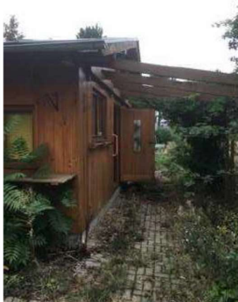
Prodejna zahradních potřeb

Objekt je umístěný na pozemku parcelní číslo 2769/2 a dříve sloužil jako prodejna zahradních potřeb k zahradnictví. Objekt je postavený na betonové desce a je jednopodlažní dřevěné oboustranně obíjené konstrukce o tloušťce 140 mm, zastřešený sedlovou střechou se střešní krytinou z pozinkovaného plechu. Klempířské prvky jsou z pozinkovaného plechu. Stropní konstrukci nahrazuje konstrukce krovu s finální vrstvou z OSB desek. Vnější povrch je řešen palubkami. Dveře dřevěné, okna dřevěná zdvojená, podlaha z OSB desek v části s položeným PVC v imitaci dřeva. V rohové části objektu je umístěné umyvadlo.