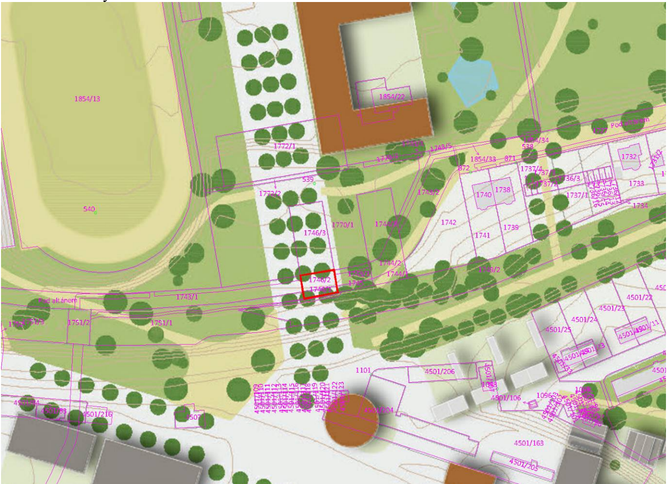
Příloha č. 6 – Výřez z US BSBS 2019