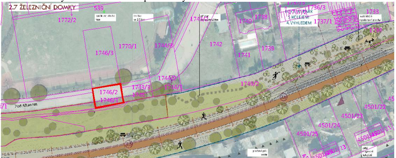
Příloha č. 7 – Výřez ze studie Drážní proměny