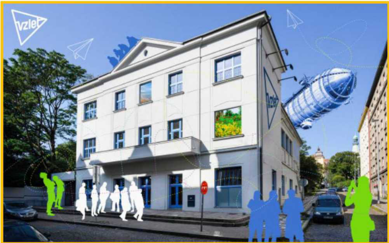
Umístění podsvětlených vývěsních štítů a světelného prvku kulturního centra