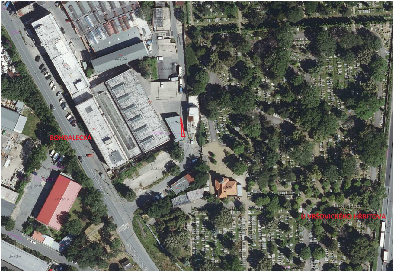
Příloha č. 3 – platný Územní plán