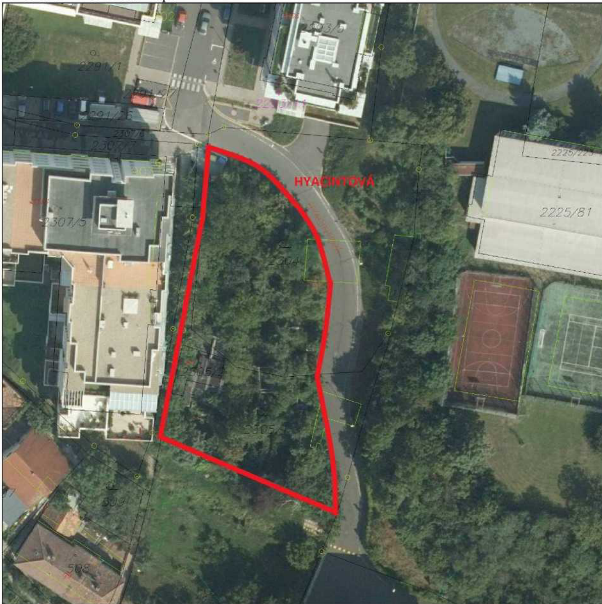
Příloha č. 2 – ortofotomapa