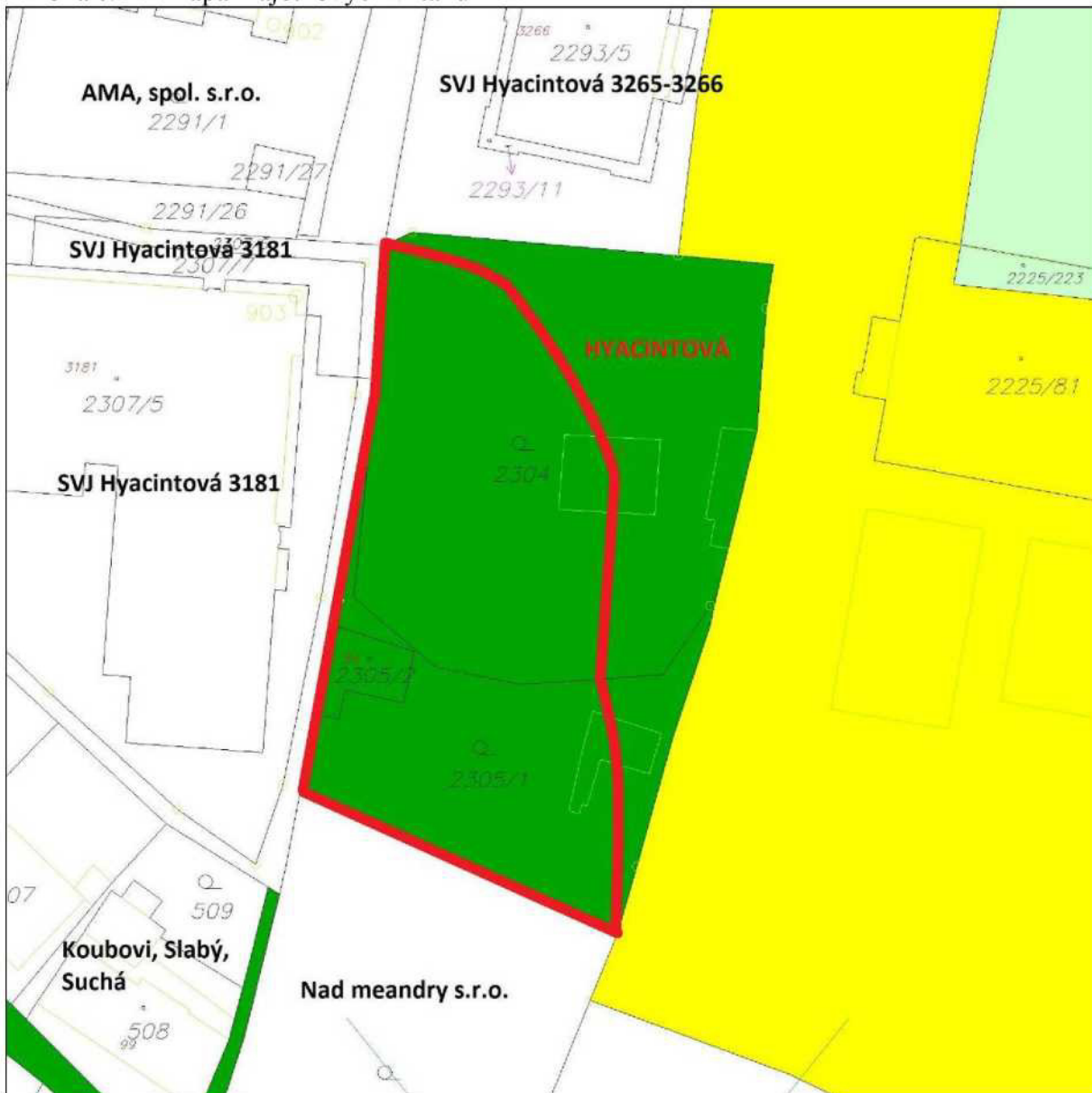
Příloha č. 1 – mapa majetkových vztahů