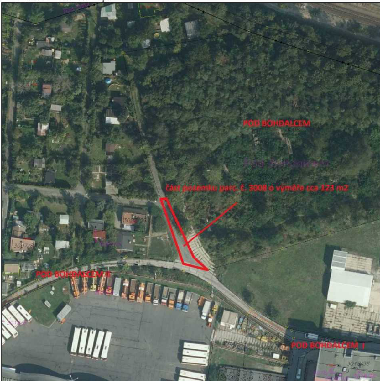
Příloha č. 2 – ortofotomapa