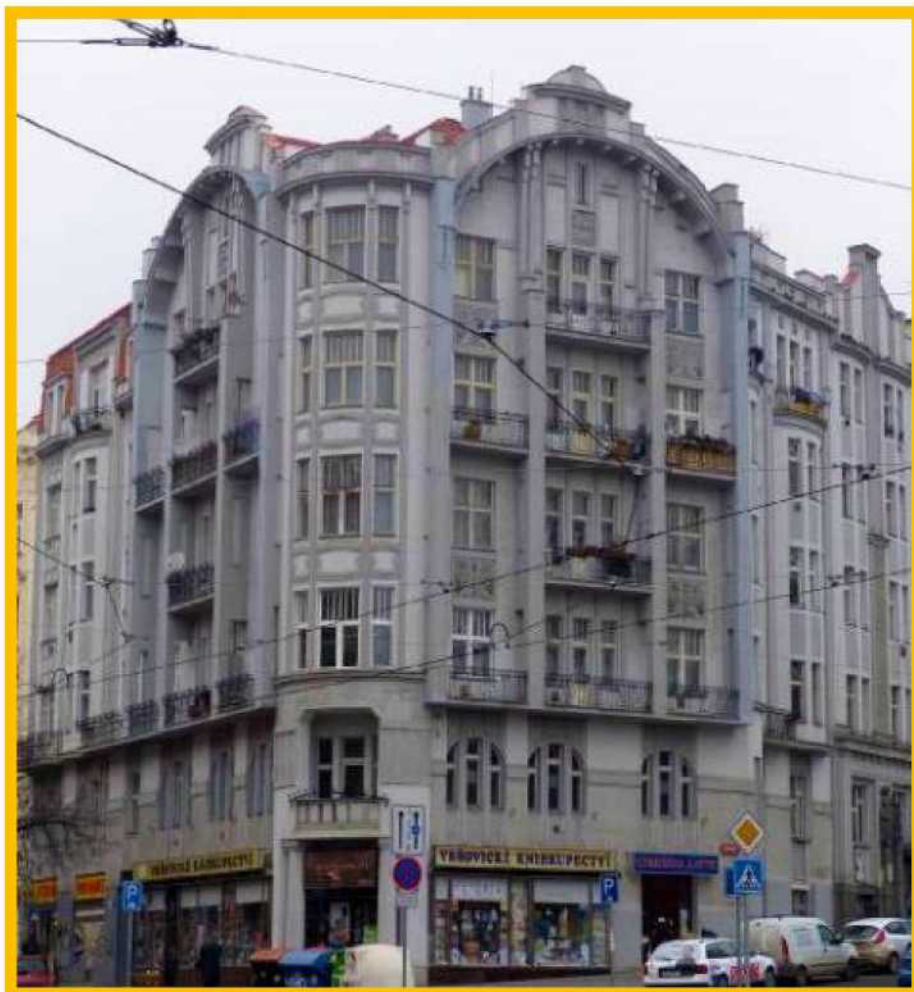
Foto Moskevská 262/57, objekt bývalého Waldesova muzea