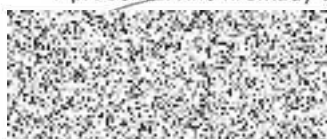
předseda valné hromady