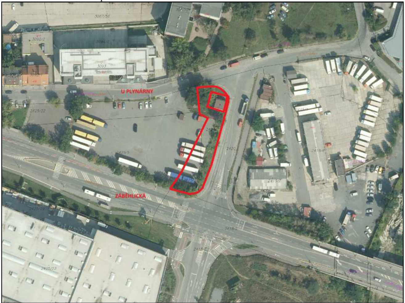
Příloha č. 2 – ortofotomapa