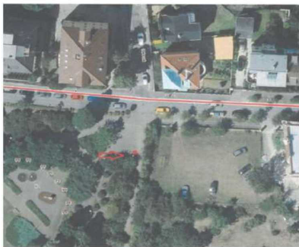
parc.č. 2031, k.ú. Stražnice, ulice Na Výsluní