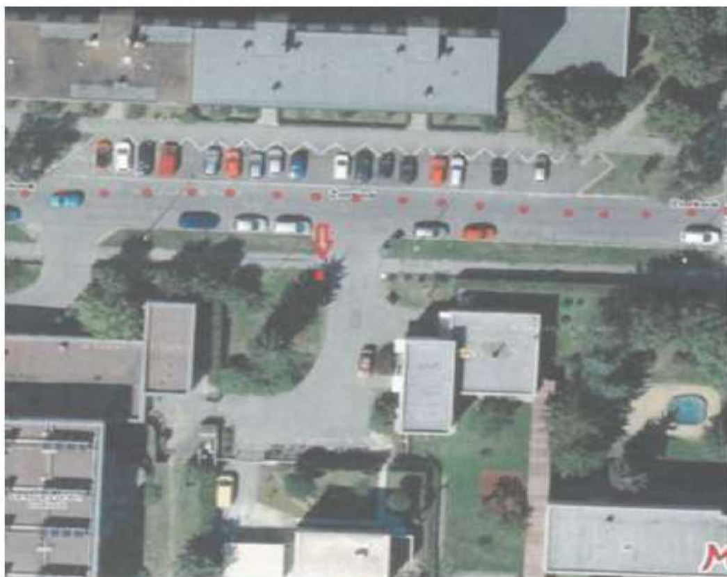
parc.č. 2078/261, k.ú. Záběhlice, ulice Zvonkovi - zeleň u MŠ