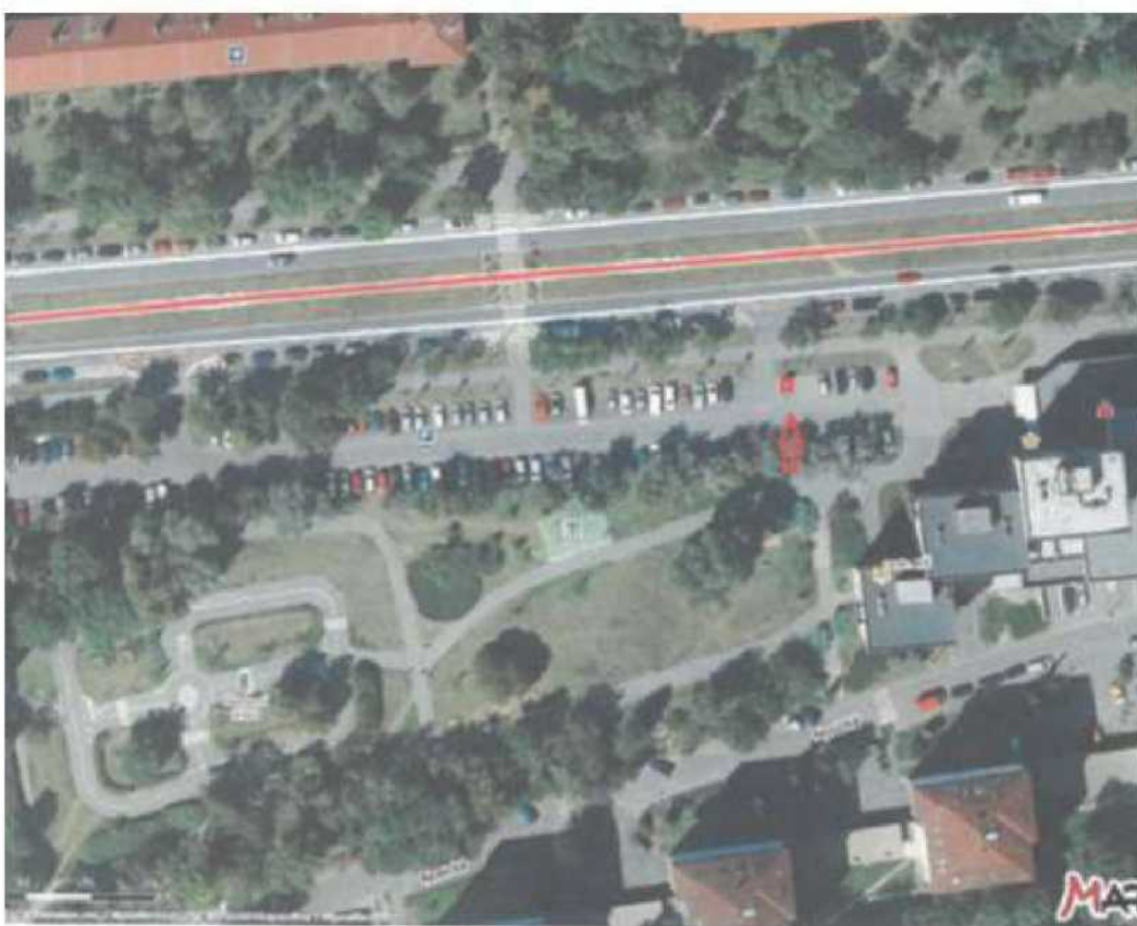
parc.č. 2809/49, k.ú. Stražnice, ulice V Olšínch - ostrůvek na parkovišti vedle druhého kontajneru