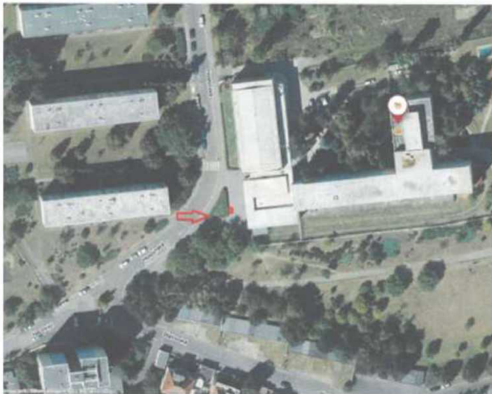
parc.č. 2244/177, k.ú. Stražnice, ulice Hostýnská 2100/2, prostor u ZŠ