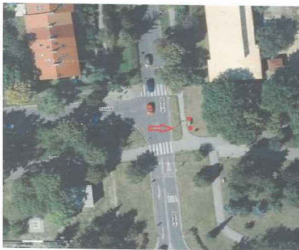
parc.č. 2796/46, k.ú. Strašnice, ulice Solidarity - u ZŠ, zeleň