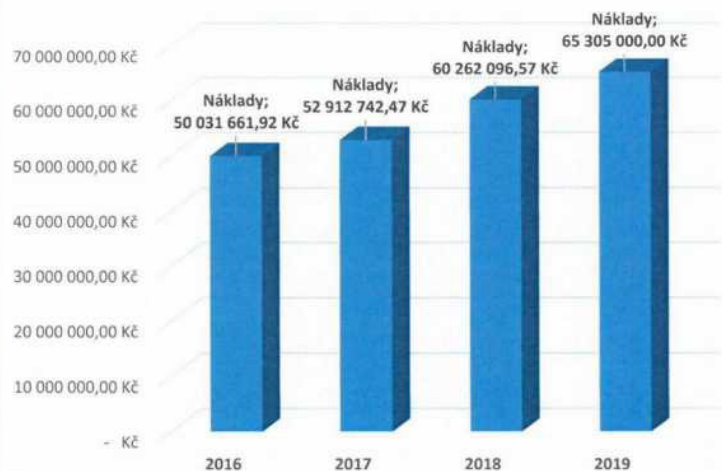
Celkové náklady za rok (přepočteno)