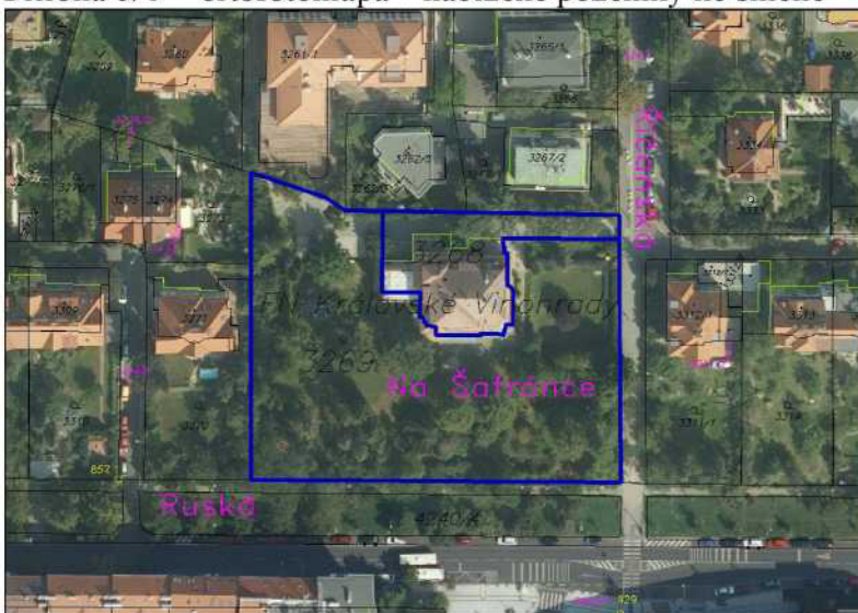
Příloha č. 6 – platný územní plán – nabízené pozemky ke směně - projednaná směna