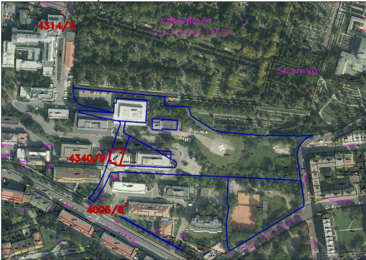
Příloha č. 3 – platný Uzemní plán