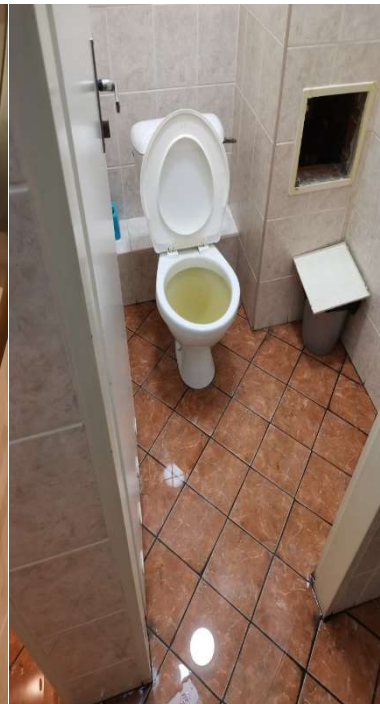
Obr. č. 13