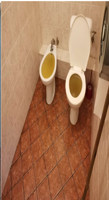
Obr. č. 12