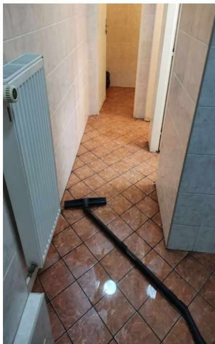
Obr. č. 11