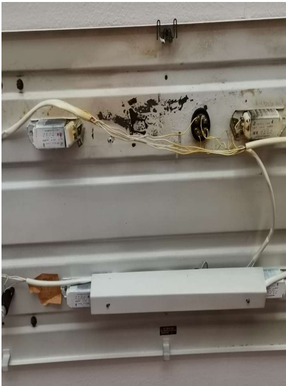
Obr. č. 9