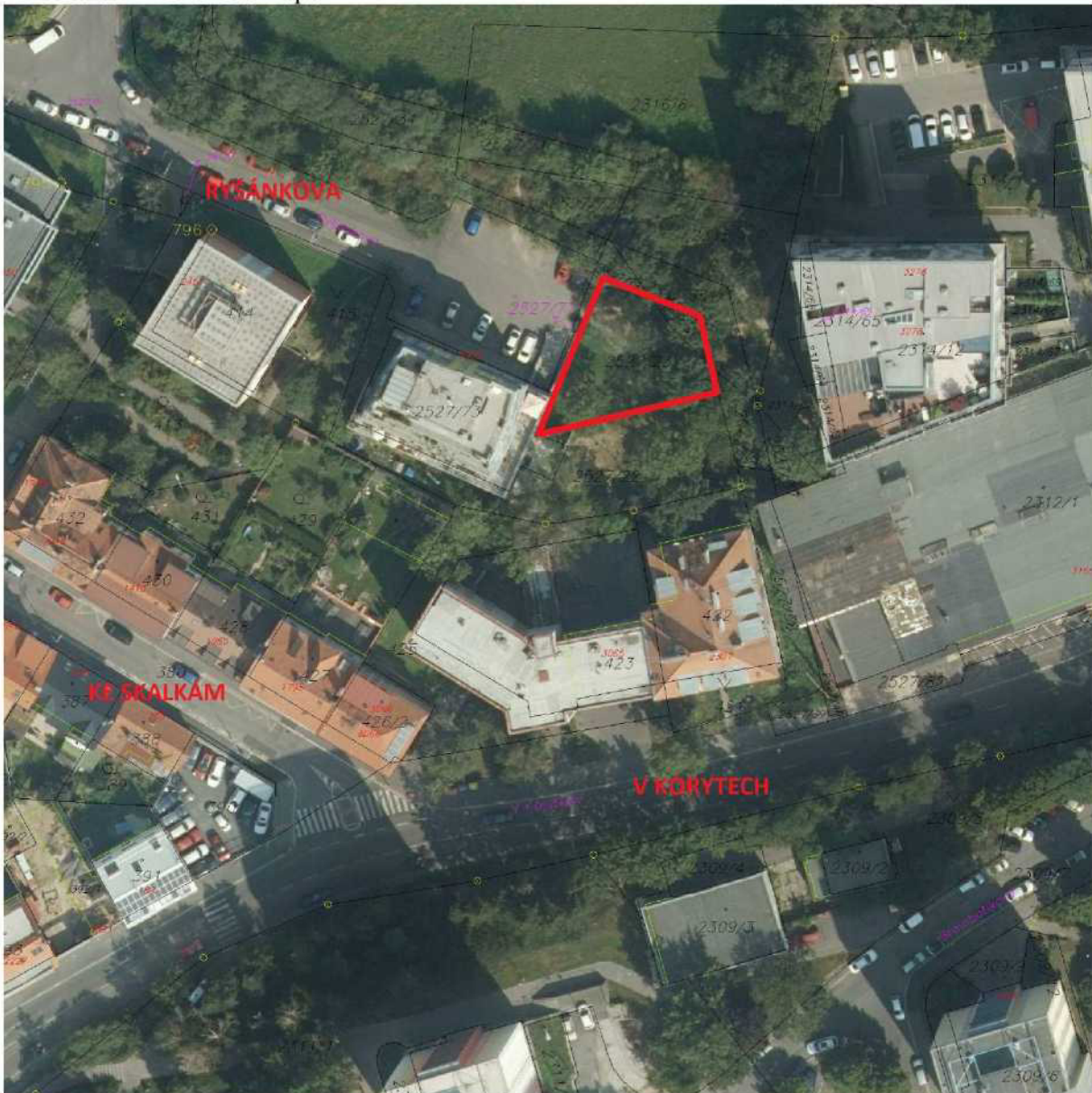
Příloha č. 2 – ortofotomapa