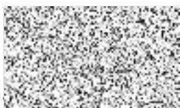
Bohumil Zoufálek 1. zástupce starosty M.č. Praha 10