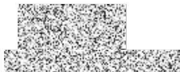
náměstkyně pro řízení sekce sociální politiky

Instrukce nabývá účinnosti dnem 1. července 2019.