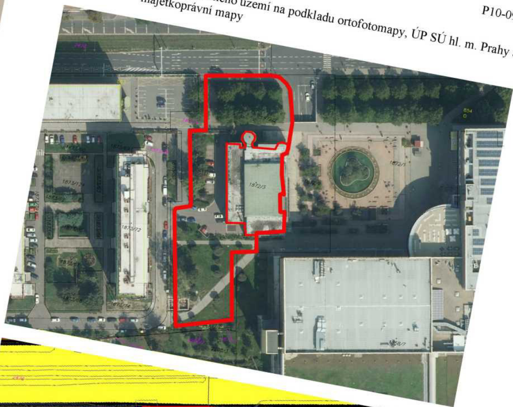
Příloha č. 1 – Vymezení řešeného území na podkladu ortofotomapy, ÚP SÚ hl. m. Prahy a majetkoprávní mapy