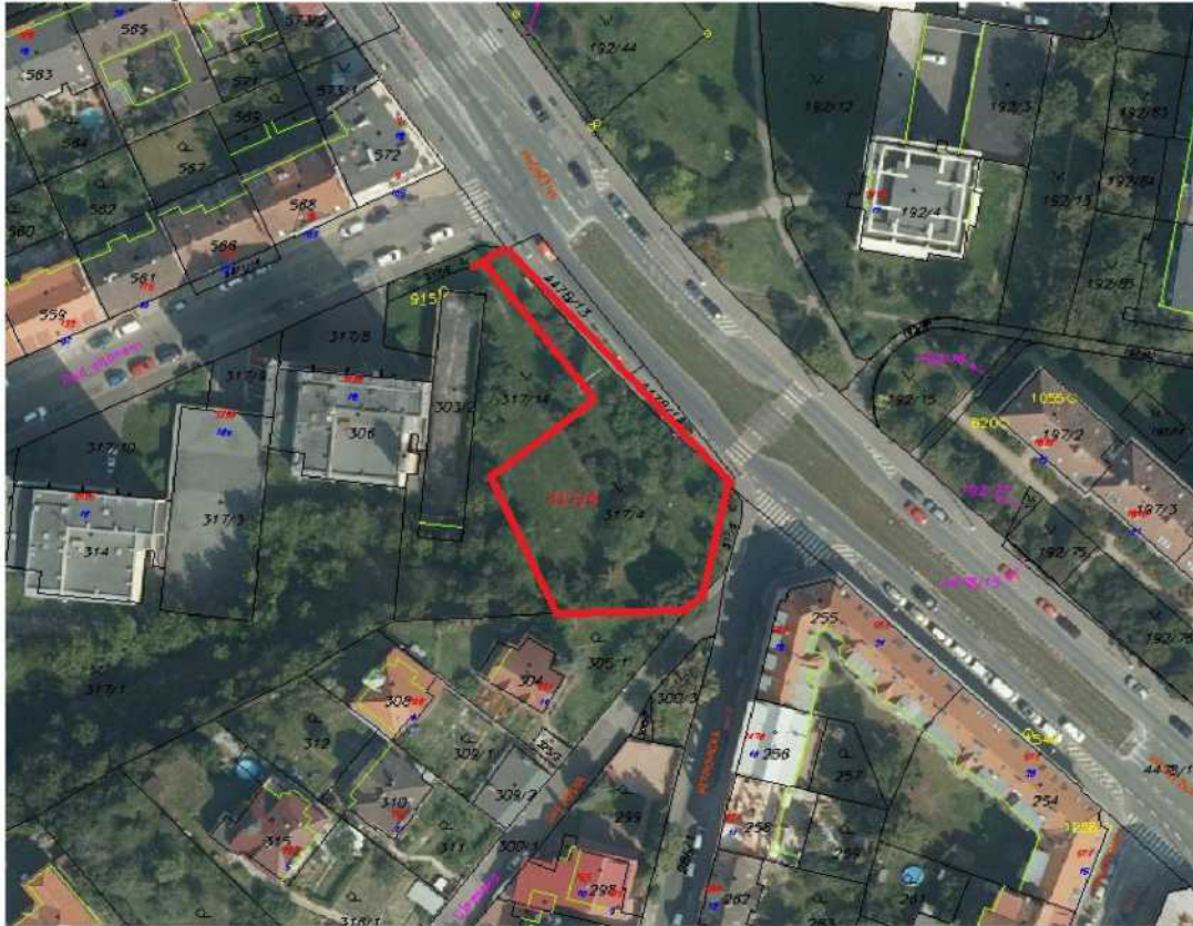
Výňatek z územního plánu SÚ hl. m. Prahy