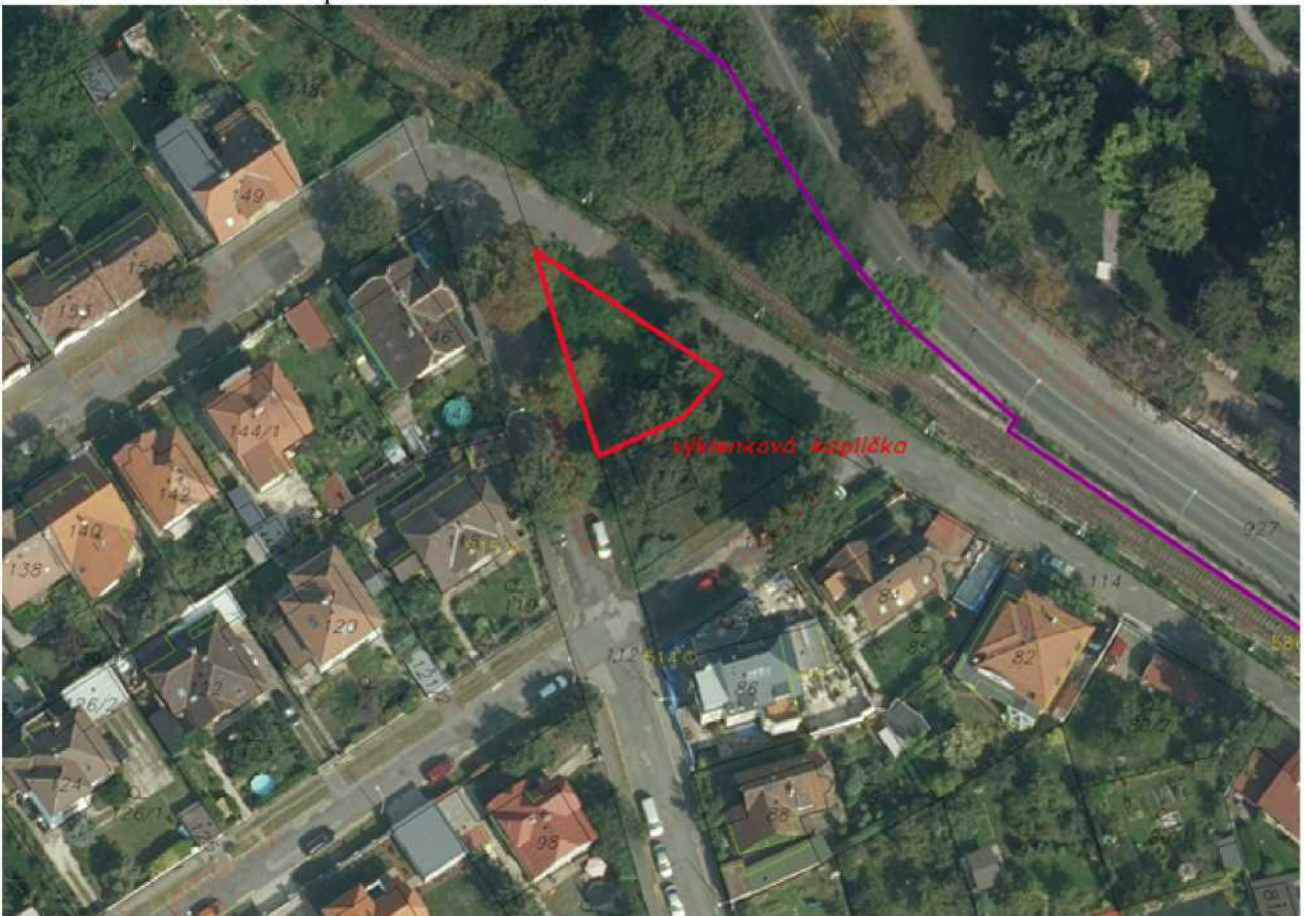
Příloha č. 3 – platný Územní plán