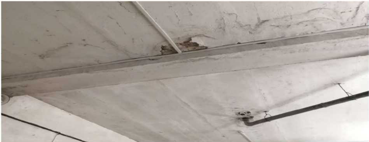
Obr. č. 15