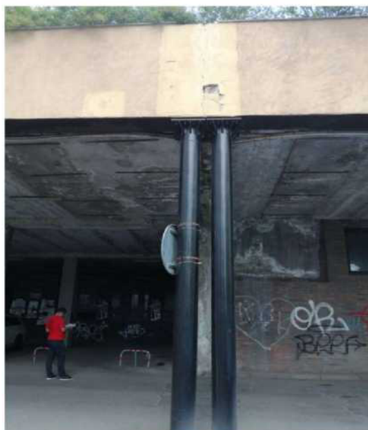
Obr. č. 12