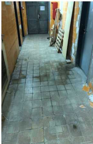
Obr. č. 8