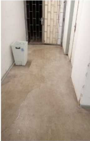
Obr. č. 7