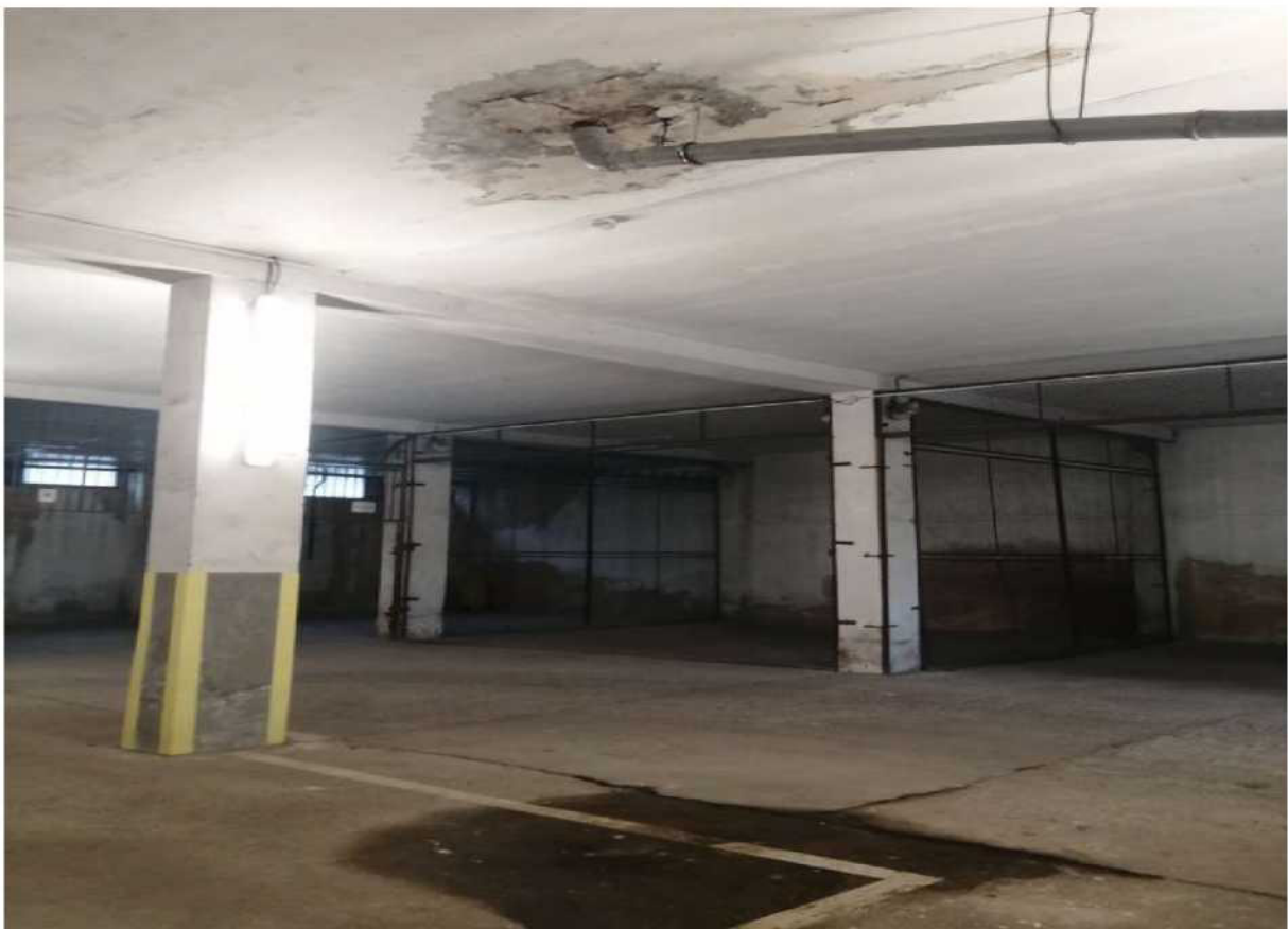
Obr. č. 16