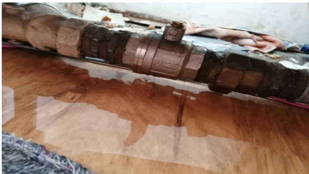
Obr. č. 14