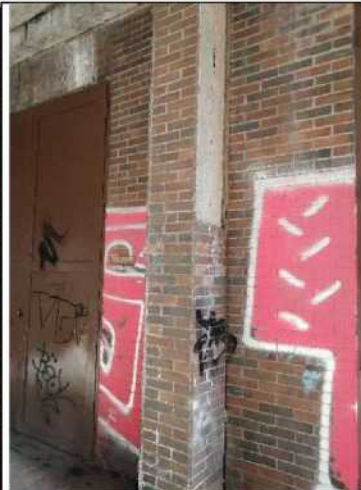
Obr. č. 8