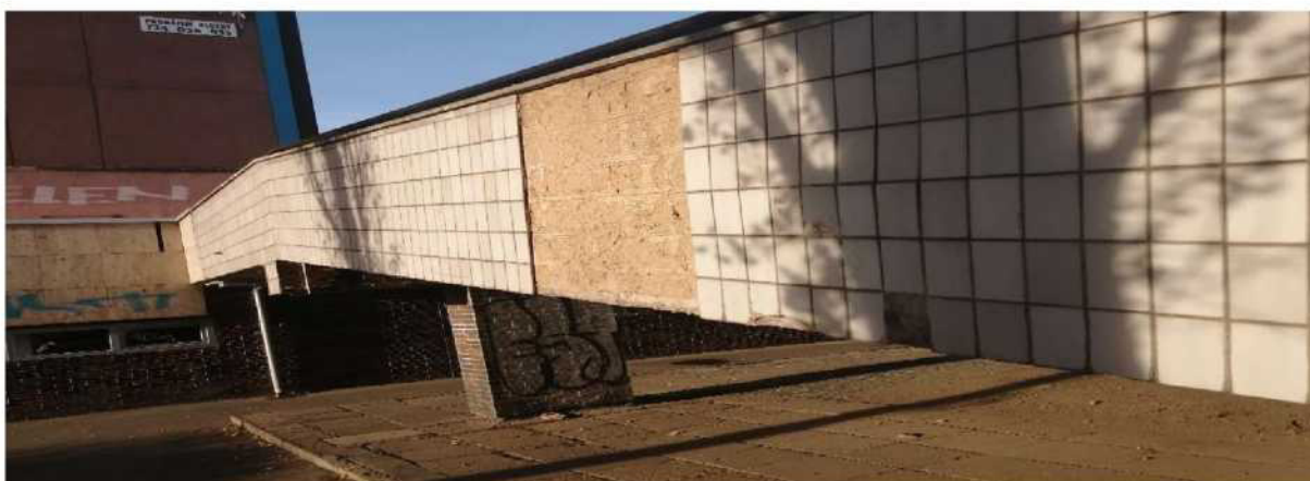
Obr. č. 15