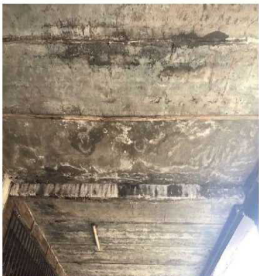
Obr. č. 13