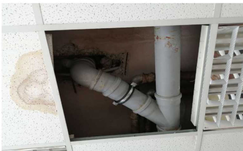
Obr. č. 12