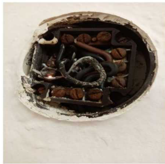
Obr. č. 10