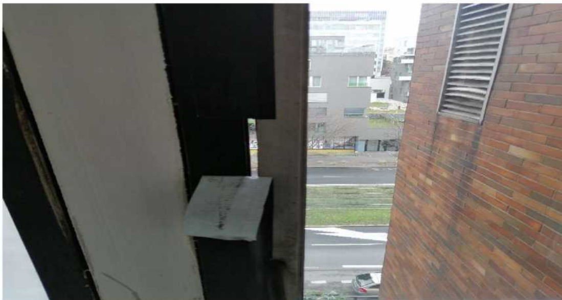
Obr. č. 11