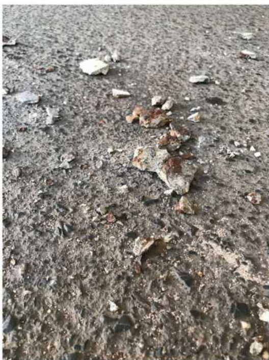
Obr. č. 14