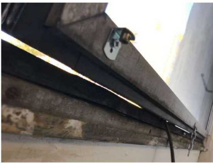
Obr. č. 18