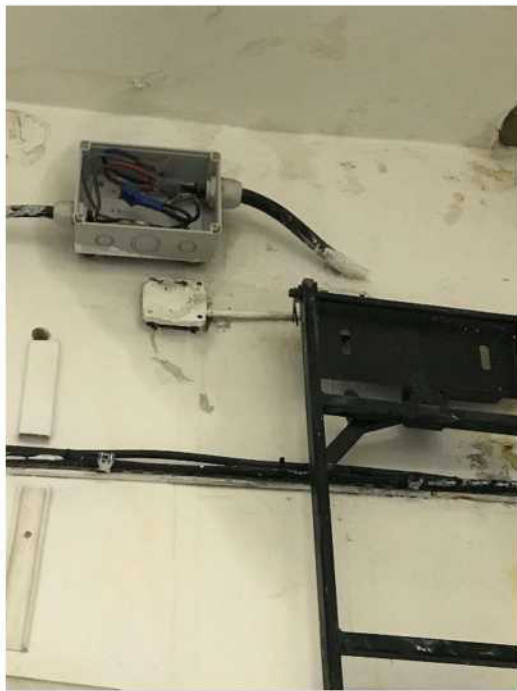
Obr. č. 16