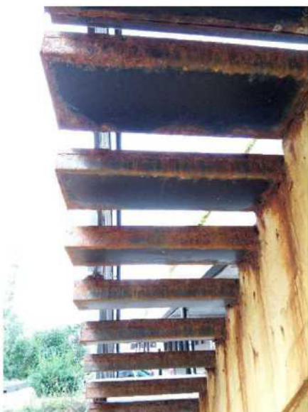
Obr. č. 10