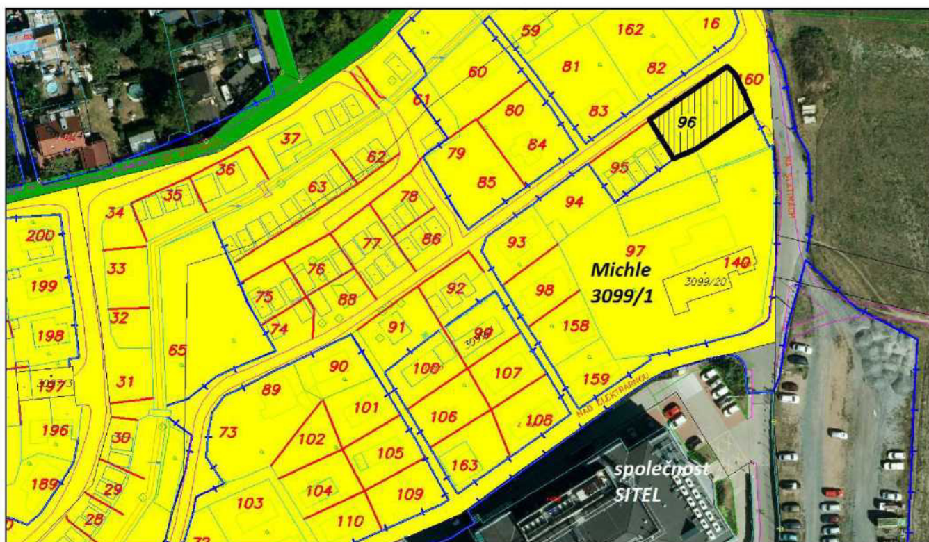
Pozemek parc. č. 3099/1, k. ú. Michle vyznačen žlutou barvou, část č. 96 černým šrafováním