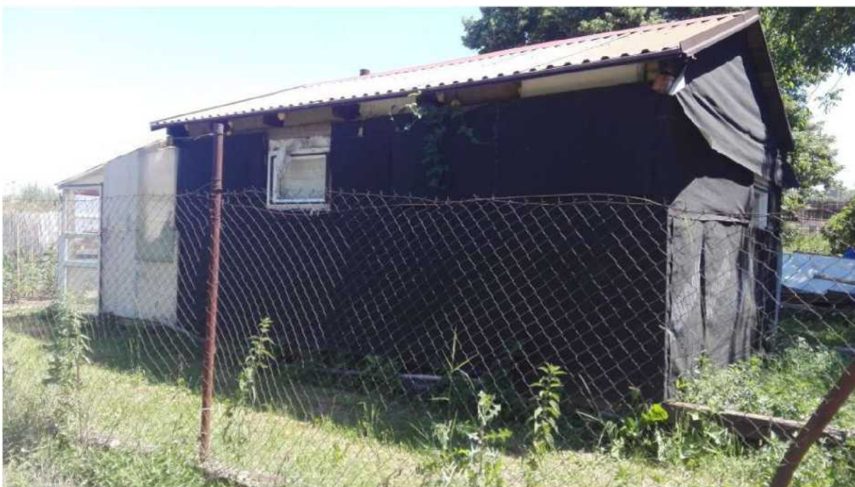
Pozemek parc. č. 3099/1, k. ú. Michle, část označená č. 96 – aktuální stav