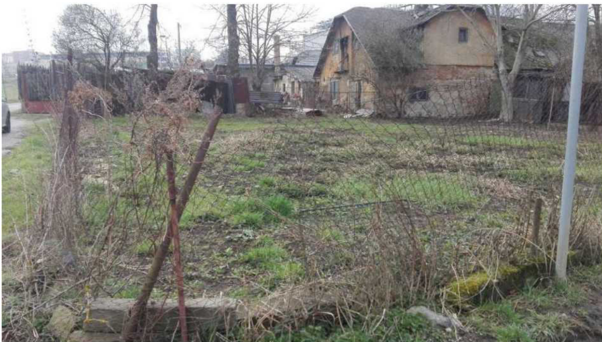
Pozemek parc. č. 3099/1, k. ú. Michle, část označená č. 96 – stav před pronajmutím Žadatelce