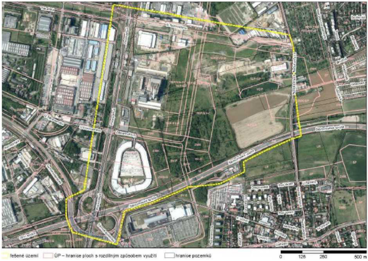
Příloha č. 2 – platný Územní plán sídelního útvaru HMP