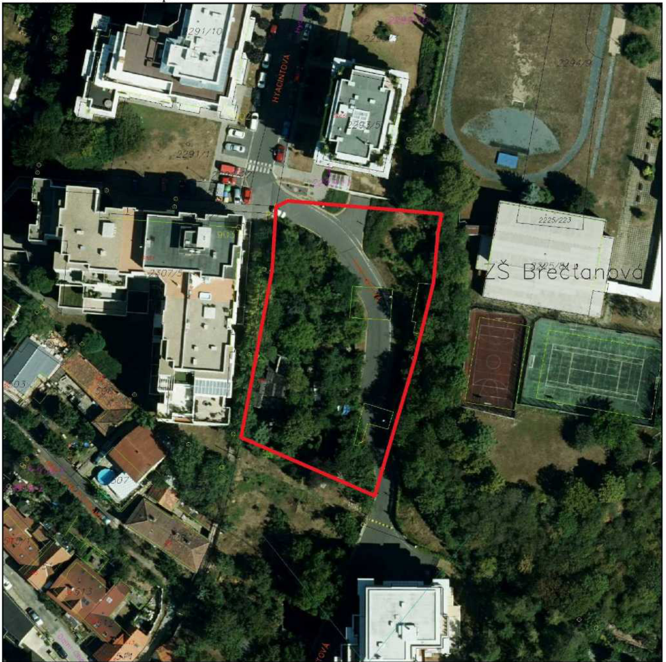
Příloha č. 2 - ortofotomapa