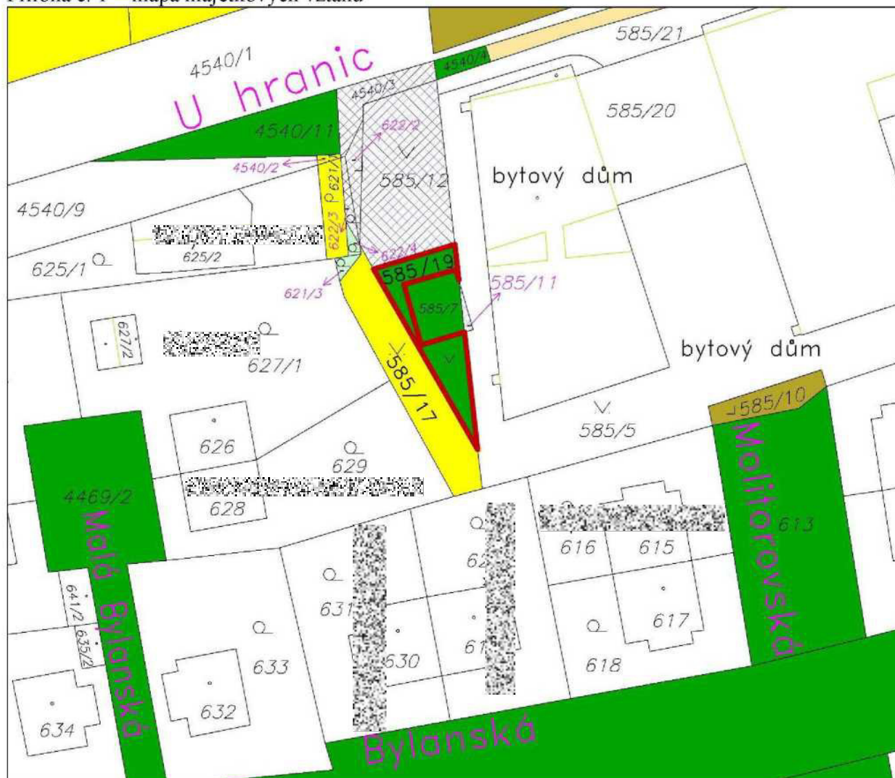
Příloha č. 1 - mapa majetkových vztahů