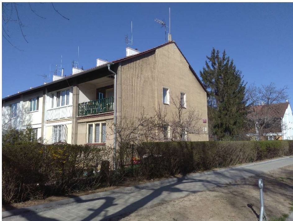
Příloha č. 3 - současný stav dochování objektu na adrese ul. Dětská 1327/102 na sídlišti Solidarita