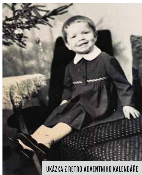
UKÁZKA Z RETRO ADVENTNÍHO KALENDÁŘE