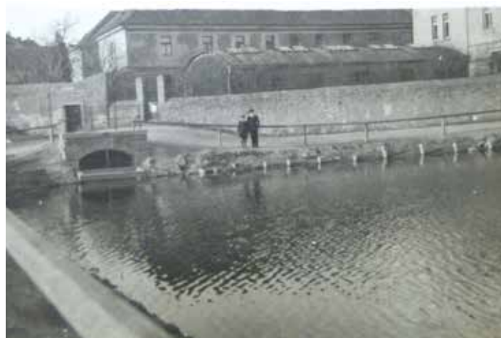
RYBNÍK V AREÁLU DNEŠNÍ GUTOVKY, STAV ZA PRVNÍ REPUBLIKY

Zdejší rybník je již dávno zasypan, většina domů a statků v jeho okolí byla zbořena, ale přesto se zde ještě nacházejí dvě stavby, které tehdejší situaci pamatují. Na severní straně u hráze stál pozdně