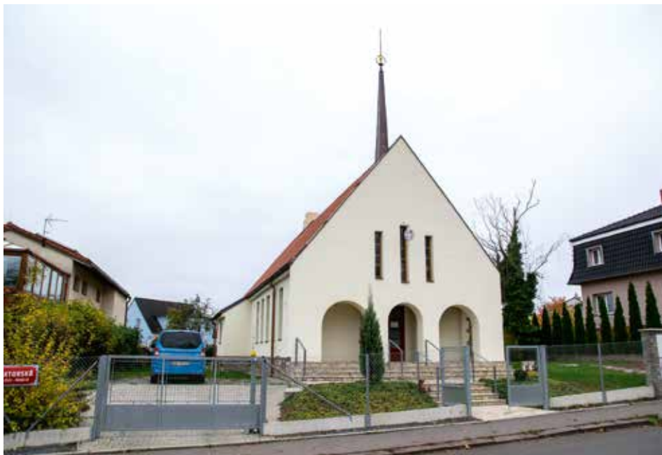
SOUČASNÁ PODOBA MILÍČOVY KAPLE A PLÁN NA JEJÍ PŘÍSTAVBU / VIZUALIZACE: JAN ŠORM, NÁVRH: DAVID VÁVRA