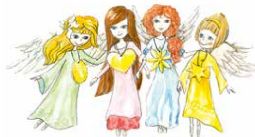
ANDÍLCI OD MONIKY NAROVCOVÉ

nezapomenutelné. Potřebují ale vaši pomoc, protože poztráceli symboly, které jim dávají sílu šířit své poslání. Pomůžete jim je najít a vrátit ztracenou sílu, aby vám opět mohli vykouzlit tu pravou vánoční atmosféru? Přitom se můžete něco nového naučit, vyzkoušet si svoje dovednosti a hezky se pobavit.