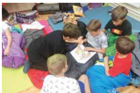
AKTIVITA SE USKUTEČNILA V RÁMCI MÍSTNÍHO AKČNÍHO PLÁNU ROZVOJE VZDĚLÁVÁNÍ II NA ÚZEMÍ MČ PRAHA 10 (MAP II), REGISTRAČNÍ ČÍSLO PROJEKTU: CZ.02.3.68/0.0/0.0/17_047/0011050

Žáci 5. C dostali dopis od Hanse Christiana Andersena, ve kterém je prosil o pomoc. Vichřice, která slouží Ledové královně, se mu chtěla pomstít a jeho pohádky rozfoukala po celé škole. Ještě před večerí se dětem podařilo všechny najít, vybarvit a spojit do knížky. Společně jsme si předčítali i další jeho pohádky. Když se setmělo, přišla na řadu strašidelná hra „Městečko Palermo“, a než jsme se uložili do svých spacáků, pustili jsme si film. Celý večer provázela samozřejmě veselá nálada a dobré jídlo.