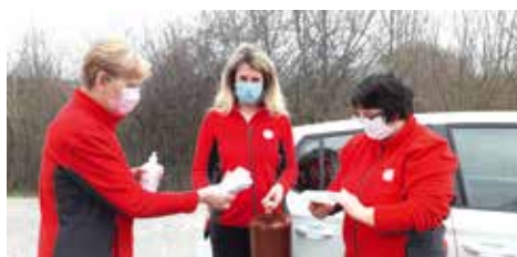
PEČOVATELKY Z CHARITY VYRÁŽEJÍ KAŽDÉ RÁNO DO SLUŽBY