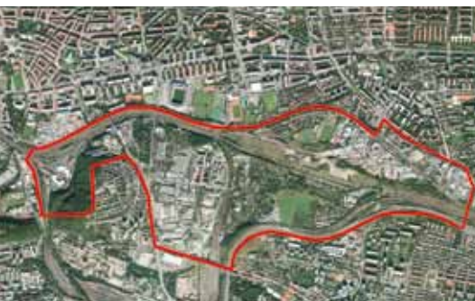
VYMEZENÍ ŘEŠENÉHO ÚZEMÍ

V tomto směru se oproti původní studii podařilo dosáhnout významného posunu, a to zadáním přesných požadavků na její dopracování na jaře letošního roku. Jde o to, aby do rodícího se Metropolitního plánu Prahy, který začne platit v roce 2023, bylo toto rozvojové území začleněno způsobem, který bude respektovat potřeby naší městské části. A to zejména pokud jde