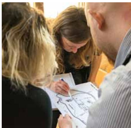
PEDAGOGOVÉ ZŠ ŠVEHLOVA NA WORKSHOPU

MUS je mezinárodní platforma, která se zaměřuje na první bližší kontakt člověka s uměleckým světem. Témata, která nabízí, lze zpracovávat v rámci výuky na prvním stupni nebo později třeba během hodin dějepisu, českého nebo cizího jazyka a samozřejmě výtvarné nebo hudební či dramatické výchovy. Forma ztvárnění, volba uměleckého přístupu nebo média jsou ponechána na uvážení pedagogů a žáků.