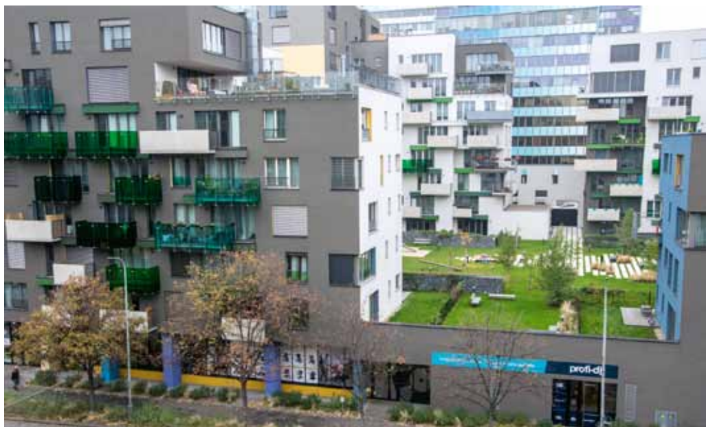
NOVÁ ZÁSTAVBA VE VRŠOVICKÉ ULICI

Developer samozřejmě i při výstavbě v Praze 10 počítá se ziskem. Je to pochopitelné, protože se jedná o podstatu podnikání. Vedení radnice se však v souladu s tím domnívá, že prospěch