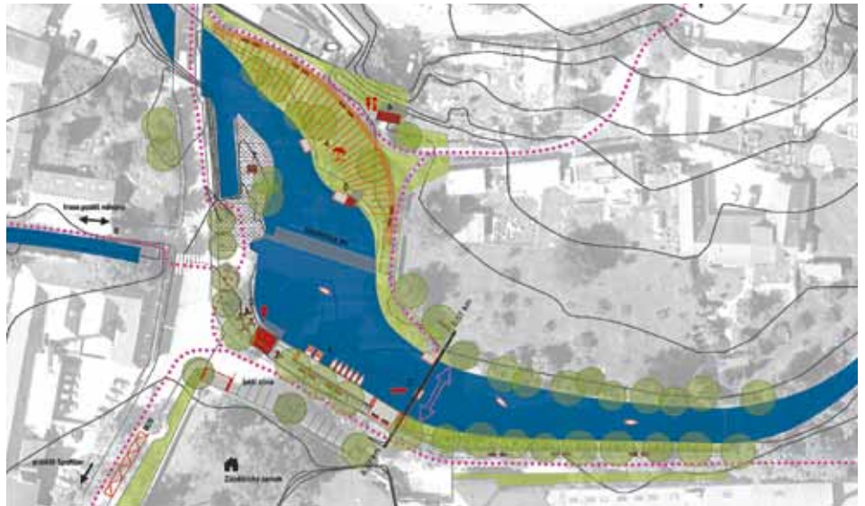
ÚPRAVY V OKOLÍ ZÁBĚHLICKÉHO JEZU

Městská část si nechala zpracovat urbanistickou studii toku Botiče jako komplexní dokument,