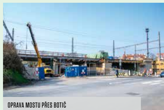
OPRAVA MOSTU PŘES BOTIČ