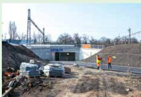
STANICE PRAHA-EDEN UŽ MÁ ŘÁDNÝ PŘÍSTUP