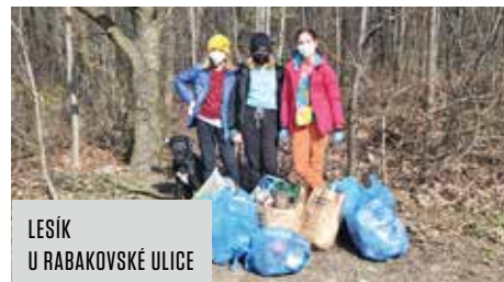
LESÍK U RABAKOVSKÉ ULICE