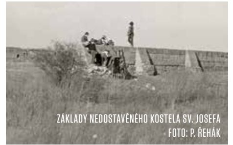
ZÁKLADY NEDOSTAVĚNÉHO KOSTELA SV. JOSEFA

Již 90 let se v této lokalitě nachází i Bacháčkova ulice. Připomíná astronoma, matematika a rektora Univerzity Karlovy Martina Bacháčka z Nauměřic (1539–1612), který akademická studia absolvoval v Praze. Poté odešel do Znojma a Vídně, kde působil jako písař biskupa Antonína Brusa z Mohelnice. Následně studoval na univerzitách v Lipsku, Altdorfu a Wittenbergu. Kolem roku 1570 se vrátil do Čech a vyučoval na městských latinských školách. V roce 1582 se stal mistrem na pražské univerzitě, kde nejraději přednášel matematiku, astronomii nebo zeměpis. Přes astronomii se seznámil s Tychonem Brahem a Janem Keplerm, kterému poskytl byt v koleji krále Václava. Spolu pak prováděli pozorování z kolejni observatoře a Bacháček se Keplera snažil získat jako profesora astronomie a matematiky, k čemuž však nakonec nedošlo. Bacháček prošel téměř všemi fakultními i kolejními úřady a v průběhu let 1599–1600 a 1603–1612 byl rektorem pražské