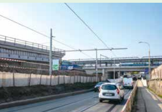
ROZŠIŘUJE SE KOMUNIKACE K PODJEZDU POD STANICÍ PRAHA – ZAHRADNÍ MĚSTO S PŘESTUPNÍM TERMINÁLEM