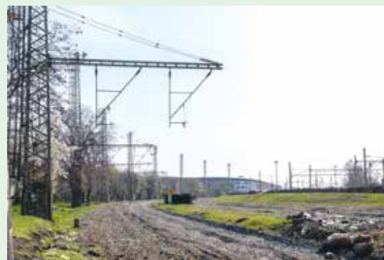
SLOUPY TRAKČNÍHO VEDENÍ, KTERÉ BY TAKÉ MĚLY ZDOBIT BUDOUCÍ PROMĚNÁDU