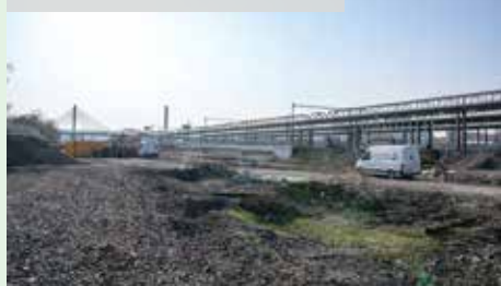
NOVÁ STANICE BUDE V PROVOZU OD ZÁŘÍ