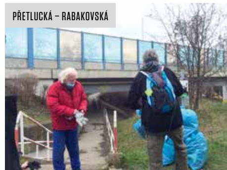
PŘETLŮCKÁ - RABAKOVSKÁ