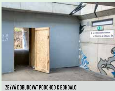
ZBÝVÁ DOBUDOVAT PODCHOD K BOHDALCI