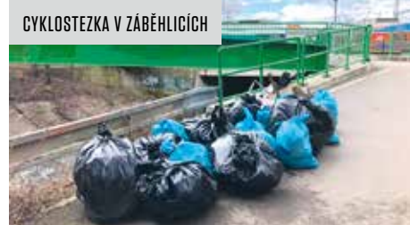
CYKLOSTEZKA V ZÁBĚHLICÍCH