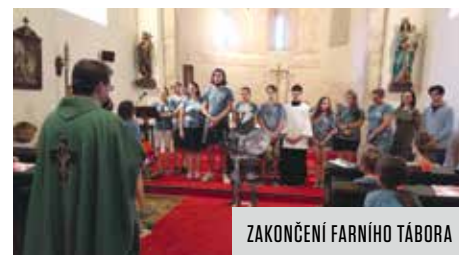
ZAKONČENÍ FARNÍHO TÁBORA

V kostele Stětí sv. Jana Křtitele, který je známý svými historickými freskami, probíhají bohoslužby každý všední den v 18.00, v sobotu v 8.00 a v neděli v 8.00, 11.00 (pro rodiny s dětmi) a 19.00 hodin. Konají se zde i varhanní mše, koncerty, tiché adorace i večery chval, křtiny, svatby, pohřby nebo ekumenická setká-