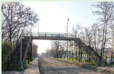
NEZMIZÍ ANI LÁVKA U BÝVALÉ STRAŠNICKÉ ZASTÁVKY