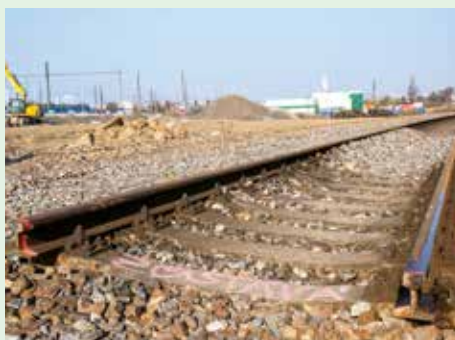
ZACHOVÁNY ZŮSTANOU NĚKTERÉ PŘIPOMÍNKY NĚKDEJŠÍHO PROVOZU