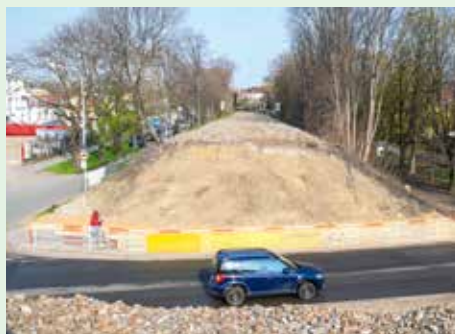
NAOPAK NOVÉ BUDE PŘEMOSTĚNÍ ULICE V KORYTECH