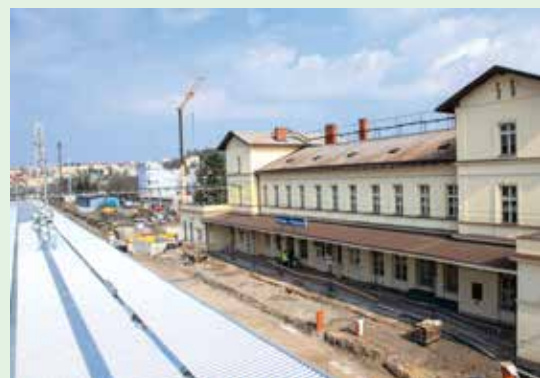
NÁDRAŽÍ PRAHA-VRŠOVICE ČEKÁ NA DOSTAVBU PRVNÍHO NÁSTUPIŠTĚ