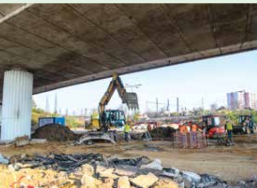
V ZAHRADNÍM MĚSTĚ POD JIŽNÍ SPOJKOU ZAČALA STAVBA NOVÉ TRAMVAJOVÉ SMYČKY

Na území naší městské části horečnatě pokračují úpravy železniční tratě Praha – Benešov a s ní související práce.