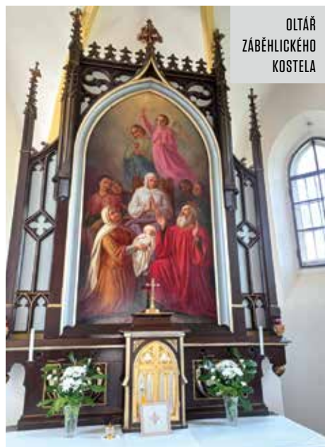
OLTÁŘ ZÁBĚHLICKÉHO KOSTELA