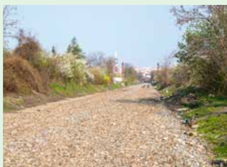
NA OPUŠTĚNÉM ÚSEKU TRATI VZNIKNE DRÁŽNÍ PROMĚNÁDA