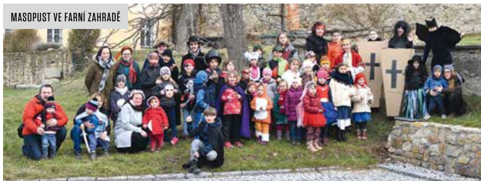
MASOPUST VE FARNÍ ZAHRADĚ

atmosféru v blízkosti jesliček. V budoucnosti zde chceme pořádat různé koncerty a výstavy.