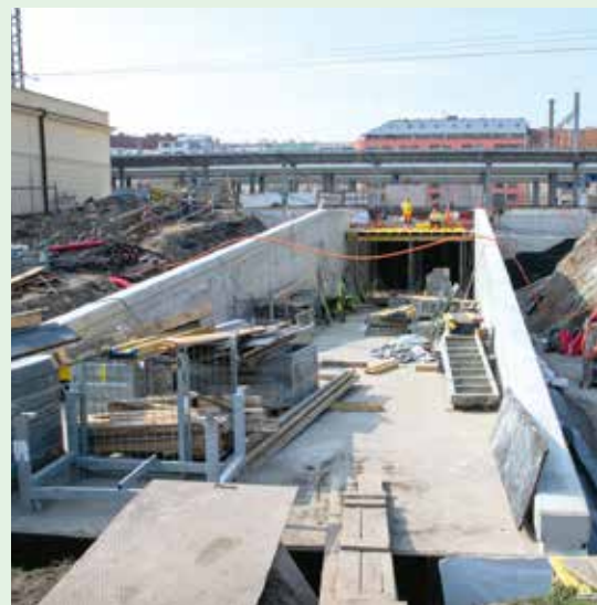
ĐÍKY PODCHODU POD KOLEJIŠTĚM SE VRŠOVICE STANOU NÁDRAŽÍM I PRO PRAHU 4