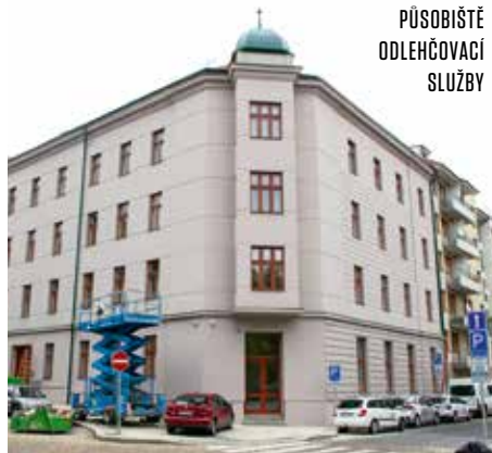
PŮSOBIŠTĚ ODLEHČOVACÍ SLUŽBY

Podle radní Mileny Johnové, která má sociální politiku na starost na Magistrátě hl. m. Prahy, je ve městě dosud prakticky nulová kapacita pobytových odlehčovacích služeb pro rodiny s dětmi se zdravotním znevýhodněním. Odlehčovací služby přitom patří mezi nejdůležitější nástroje podpory rodin. „Usilujeme proto o co nejrychlejší rozvoj pomoci rodinám ohroženým vyčerpáním z náročné péče. Do roku 2023 chceme vytvořit síť nových zařízení na různých místech Prahy, aby se zlepšila místní dostupnost. Služba v Praze 10 bude první z nich a pevně doufám, že začne fungovat již na sklonku tohoto léta,“ doplnila radní Johnová.