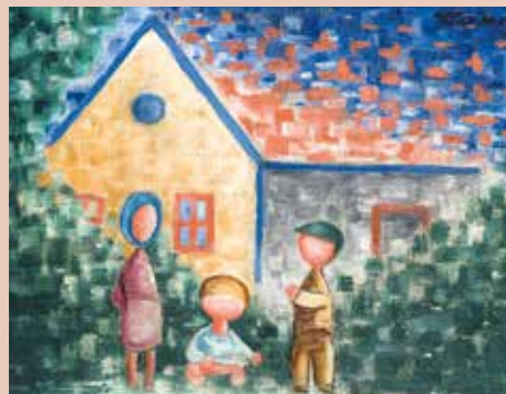
DĚTI U DOMU, 1931

duben Námořník na galéře umění výstavy o životě a díle Josefa Čapka park Jiřího Koláře náměstí Svatopluka Čecha od 25. dubna