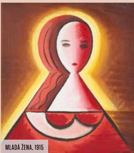
MLADÁ ŽENA, 1915