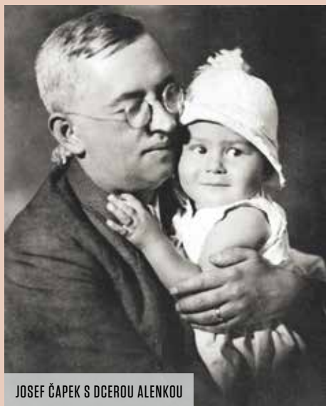
JOSEF ČAPEK S DCEROU ALENKOU

na Josefa Čapka. To nejdůležitější o životě a díle proslulého malíře, kreslíře, spisovatele, básníka, novináře a našeho souseda z Vinohrad se dozvíte především na venkovní výstavě „Josef Čapek – námořník na galéře umění“. Soubor instalovaný na velkoplošných panelech je rozdělen do dvou částí – v parku Jiřího Koláře se můžete podrobněji seznámit s Čapkovým osudem, zatímco na náměstí Svatopluka Čecha proniknete hlouběji do jeho rozmanité výtvarné tvorby. Nechte se nalákat ukázkami, které přinášíme na této stránce!