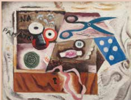
ZÁTIŠÍ S NŮŽKAMI, 1916