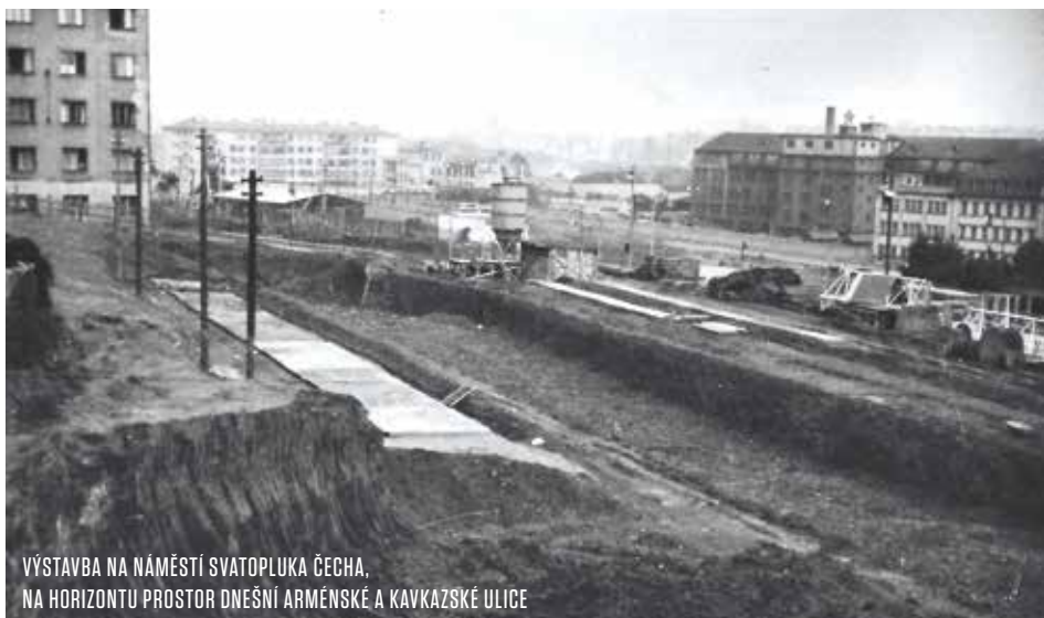
VÝSTAVBA NA NÁMĚSTÍ SVATOPLUKA ČECHA, NA HORIZONTU PROSTOR DNEŠNÍ ARMÉNSKÉ A KAVKAZSKÉ ULICE

české architektury šedesátých let minulého století. Váže se k ní mimo jiné jedna zajímavost. V roce 1969, ještě před kolaudací, vypukl v horních patrech budovy požár. Hasiči si však v první fázi nedokázali s vysokou stavbou poradit – z krátkých přistavených žebříků totiž nedokázali na oheň dostříknout. Když konečně dorazila technika s vyšším žebříkem, zase se rozpojila hadice a přihlížející občané byli zkropeni vodou. I přes tyto nesnáze se podařilo budovu brzy uhasit.