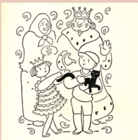
DEVATERO POHÁDEK, ILUSTRACE