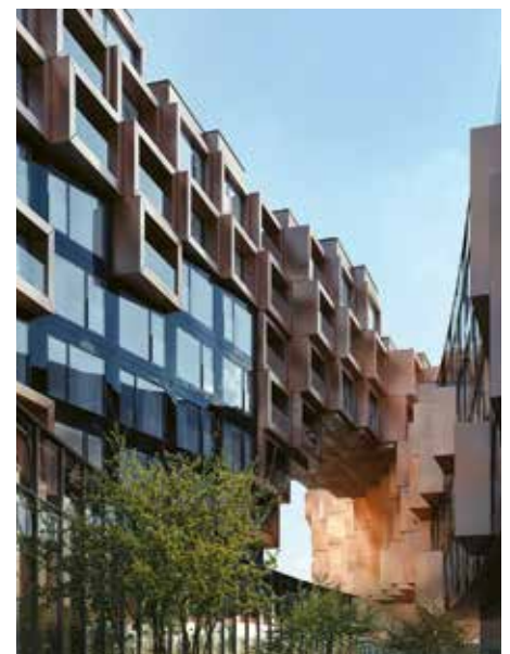
Bytový dům Fragment společnosti Trigema v pražském Karlíně.