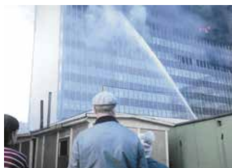
POŽÁR BUDOVY CHEMAPOLU PŘED JEJÍM OTEVŘENÍM

V současné době se hodně diskutuje záměr na zbourání areálu, na jehož místě by měl vzniknout velký bytový komplex. Proti demolicí se postavili někteří odborníci, kteří tuto stavbu označují za příklad vynikající