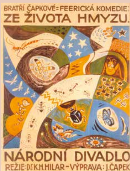
JOSEF ČAPEK, NÁVRH PLAKÁTU