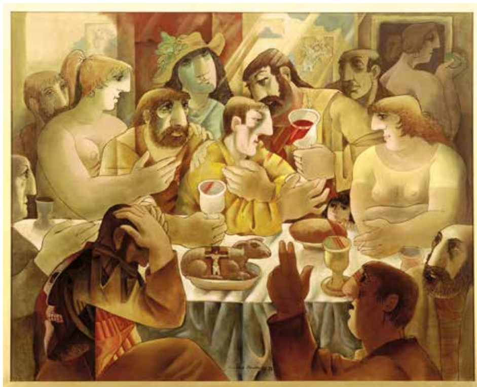
OLTĀRNÍ OBRAZ POSLEDNÍ VEČEŘE, BIELEFELD, 1989

V roce 1973 vystavoval s kolegy z Proměny naposledy. Expozice i její vernisáž měly úspěch, avšak ve stejné době se konalo zasedání ÚV KSČ. Horlivá novinářka Rudého práva bezdůvodně označila tvůrčí skupinu za nátlakovou a výstava byla ihned uzavřena.