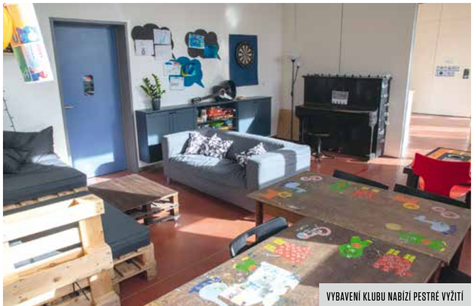
VBÁVENÍ KLUBU NABÍZÍ PESTRÉ VYUŽITÍ

Za dobu, kdy je klub otevřen, ho navštívilo více než sto dětí, každý den se jich tady objeví přibližně 10–15. Jejich zdejší čas nemá předepsanou náplň, mohou si vybrat jakoukoliv z nabízených aktivit, vyzkoušet si něco nového. Výjimku představují rozvojové zájmové činnosti neboli „zájmovky“, probíhající v poslední hodině každého dne. Zabývají se výtvarnou tvorbou, sportem nebo diskuzemi