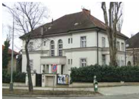
Vila s číslem 24

Hned dům číslo 6 je význačný svým původním i současným majitelem. V knize Kapitoly z pražské historie uvádí Karel Výrut, že ve dvacátých letech minulého století si tuto vilu nechal postavit významný český politik a předseda vlády Rudolf Beran. Dnes zde sídlí Český olympijský výbor.