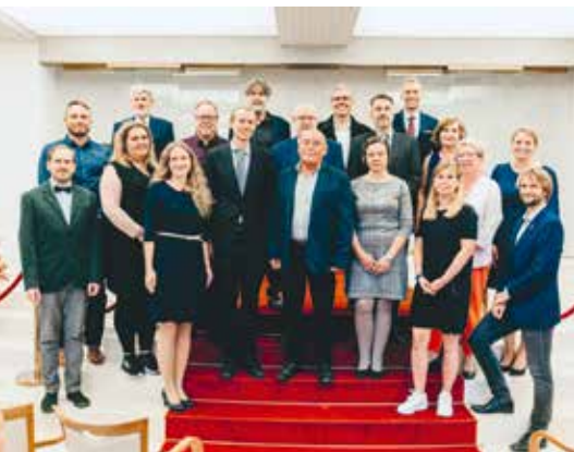
CENA BRATŘÍ ČAPKŮ SE UDĚLUJE NEJLEPŠÍM UČITELŮM DESÍTKY

Cena bratří Čapků se od roku 2017 uděluje za osobní přínos ke zkvalitňování úrovně školy a za humánní, empatický a laskavý přístup k dětem v mateřských a žákům v základních školách, které zřizuje.