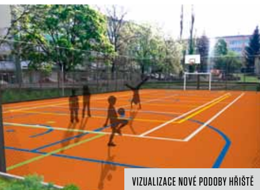
VIZUALIZACE NOVÉ PODOBY HŘIŠTĚ

V současné době se rekonstruuje hřiště v Gollově ulici v Malešicích mezi bytovým domem a objektem bývalé zemědělské usedlosti. Ještě nedávno bylo ve zcela nevyhovujícím stavu. Původní živичný povrch byl poškozený, mobiliář v jeho okolí prakticky chyběl, a proto hřiště nikdo nevyužíval.