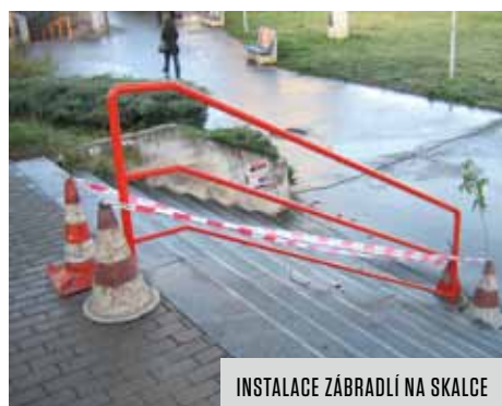
INSTALACE ZÁBRADLÍ NA SKALCE

Odbor životního prostředí, dopravy a rozvoje ÚMČ Praha 10 průběžně přijímá podněty občanů Prahy 10 a řeší faktické možnosti úprav, případně podněty předává kompetentním orgánům.