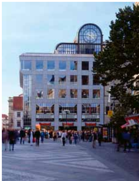
ADMINISTRATIVNÍ BUDOVA ČKD NA MŮSTKU, DNES OBCHOD NEW YORKER

Ano, tohle je opravdu šílené. S obyčejným ba-