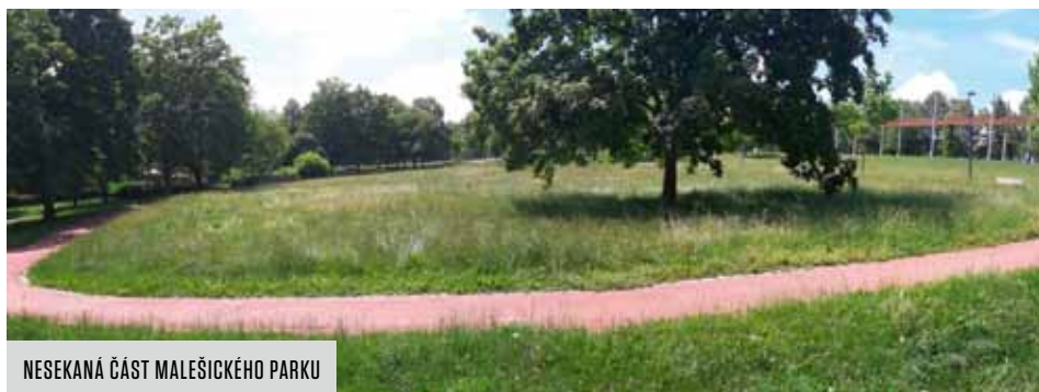
NESEKANÁ ČÁST MALEŠICKÉHO PARKU

K úpravě péče o trávníky a zeleň se v poslední době odhodlalo více českých a moravských měst. Téma je také velmi živé v diskuzi na internetu a sociálních sítích. V diskuzi by však měly převážet odborné názory. Například Společnost pro zahradní a krajinářskou tvorbu ve svém prohlášení z 12. června 2019 uvádí, že je zcela chybným postupem zrušení kosení v jarním období, navíc při dostatku vláhy, který panoval během letošního jara. Naopak v letním horkém počasí s vláhovým deficitem by mělo být kosení omezeno. Výška seče by měla korespondovat s typem trávníků a způsobem jejich využití. Při seči nesmí být poškozeny odnožovací části rostlin. „Městská část Praha 10 přijala taková opatření, kdy instruujeme smluvní společnosti ke zvýšení sekání trávy na výšku 8–10 cm z původních 4–6 cm v minulosti. K sekání nyní dochází v brzkých ranních hodinách, kdy teplota nedosahuje negativních hodnot pro tuto činnost. Úřad MČ a naši správci zeleně dostali dále za úkol vytipování ploch vhodných pro snížení sekání trávy na dvě seče ročně. Toto se samozřejmě netýká rekreačních a pobytových ploch, u kterých musí být i nadále zaručena provozuschopnost,“ informuje vedoucí odboru životního prostředí, dopravy a rozvoje Martin Pecánek.