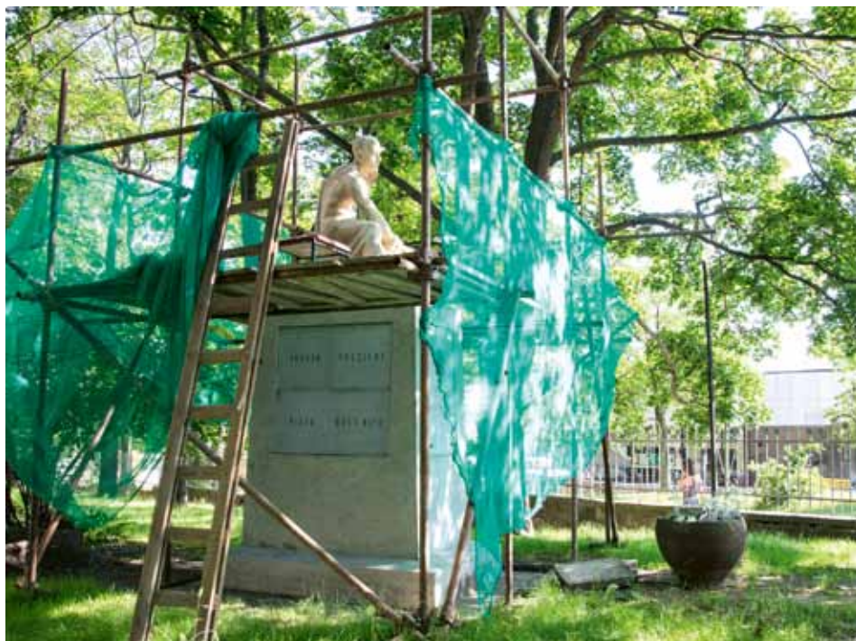
POMNÍK V PRŮBĚHU RESTAUROVÁNÍ