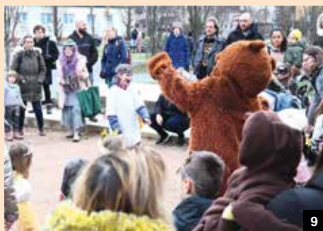
8-9 / PRŮVOD KLUBU K2 V ZAHRADNÍM MĚSTĚ