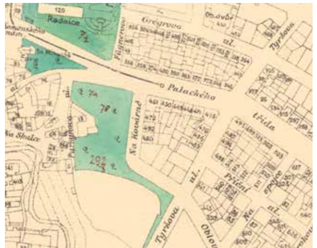
TYRŠOVA ULICE, NYNÍ ŽITOMÍRSKÁ, KŘÍŽUJÍCÍ PALACKÉHO, DNES MOSKEVSKOU.

Mezi Žitomírskou a Minskou se od roku 1947 nachází Orelská ulice. Teoreticky by se mohla jmenovat třeba podle orla mořského, ale ve skutečnosti se označuje podle ruského města Orel, které se nachází jižně od Moskvy. Původně v letech 1910–1940 a pak ještě klasicky 1945–1947 to byla Příční ulice, což naznačovalo její vztah k dalším ulicím v okolí. Po nástupu německých okupantů se ani jí nevyhnul „říční“ osud, který měl přitom uvrhnout v zapomnění slavné české osobnosti. Nově se tedy nazývala Vážská (Waaggasse) podle nejdelší