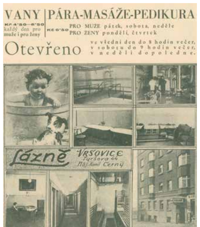
LÁZNĚ Z DVACÁTÝCH LET V TYRŠOVĚ ULICI V DOMĚ ČP. 44