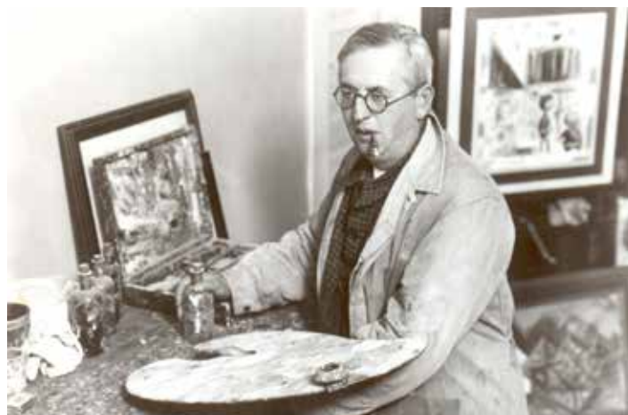
JOSEF ČAPEK (* 23. 3. 1887 HRONOV, † DUBEN 1945 BERGEN-BELSEN)