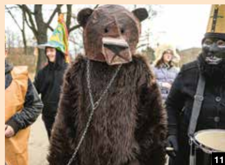
10-11 / PRŮVOD ZŠ SOLIDARITA