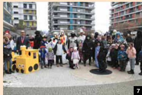
6-7 / MASOPUST V MALEŠICÍCH