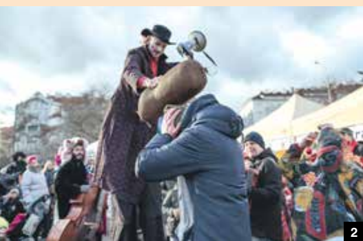
1-5 / MASOPUSTNÍ REJ NA ČECHÁČI A U VZLETU