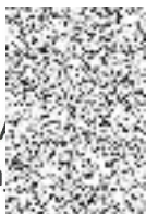
Mg. Glinská ta /boru

Zápis z 13. jednání Výboru pro sport a volnočasové aktivity byl vyhotoven dne 26.6.2024. Zápis z jednání výboru Zastupitelstva městské části Praha 10 je pro účely jeho zveřejnění způsobem umožňujícím dálkový přístup upraven tak, aby jeho podoba byla v souladu s právními předpisy, upravujícími ochranu informací, zejména ochranu osobních údajů, osobnosti a soukromých fyzických osob. Originál prezenční listiny je uložen u tajemníka výboru.