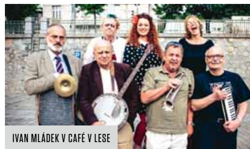
IVAN MLÁDEK V CAFÉ V LESE