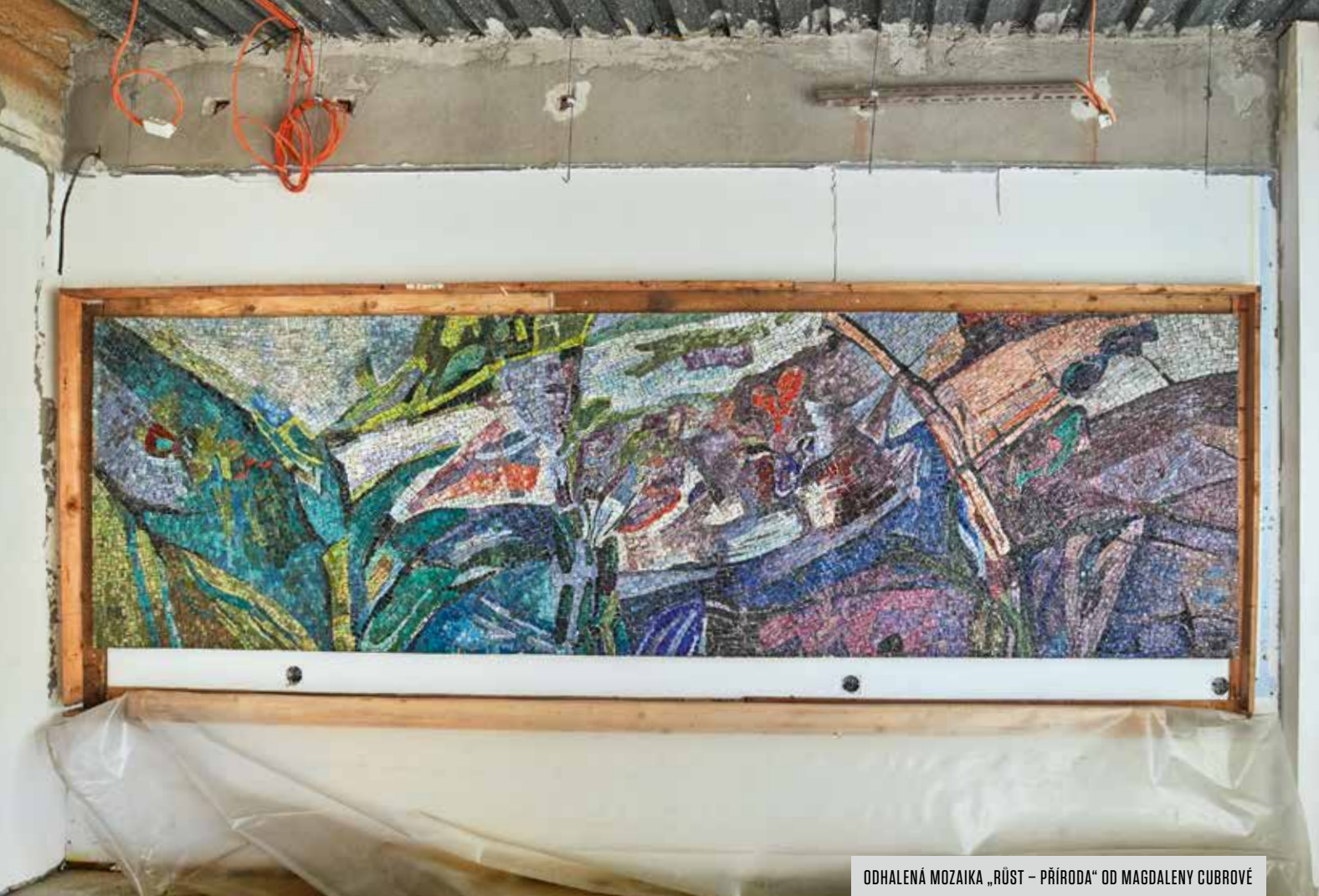
ODHALENÁ MOZAIKA „RŮST – PŘÍRODA“ OD MAGDALENY CUBROVÉ