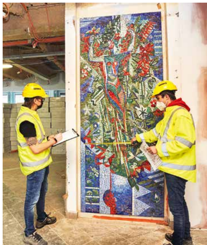
PRŮZKUM MOZAIKY „PŘÍRODA A HYGIENA“ OD DALIBORA ŘIHÁNKA

Nález mozaiky lehce zkomplikoval harmonogram rekonstrukčních prací, ale cenný umělecký výtvar bude vítanou přidanou hodnotou nové podoby zdravotnického zařízení. Navíc když nezůstane jen u jednoho kousku. Při přestavbě totiž spatřila světlo světa také další mozaika „Příroda a hygiena“. Námětem menší kompozice ze stejné doby je ženská figura s florálními a bylinnými prvky, představující symbol čistoty a léčitelství.