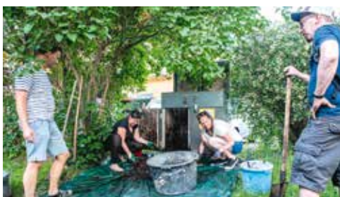
KOMUNITNÍ ÚDRŽBA KOMPOSTÉRU VE VNITROBLOKU LVOVSKÁ

Již několik let u nás ale funguje také komunitní kompostování. Díky němu mohou s domácími biologickými zbytky odpovědně nakládat i ti, kteří sami nemají prostor pro vlastní kompostér. V takovém případě se pro něj hledá místo, aby byl přístupný větší skupině uživatelů. U komunitních kompostérů, které jsou v péči radnice Prahy 10, se většinou jedná o vnitroblokové plochy veřejné zeleně. Celkem jsou dostupné na deseti místech a mají podobu větší skříňe vybavené víkem pro vhadzování rostlinného materiálu a dvířky k snadnějšímu vybírání hotového materiálu.