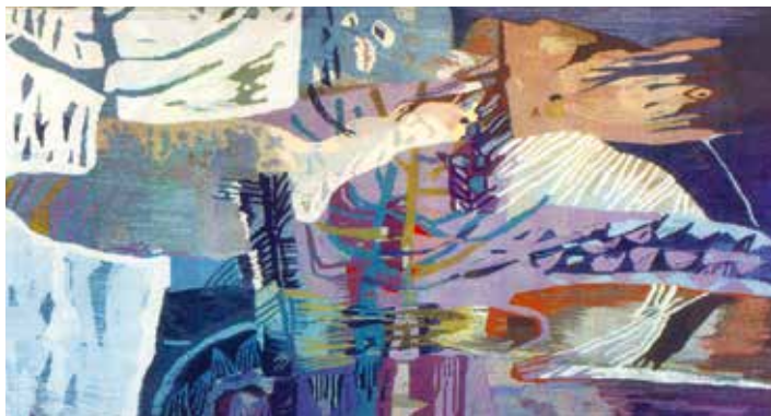
VLNĚNÝ GOBELÍN „KRÁSY PŘÍRODY“, 1990, VŠE PRAHA

Studovala jsem v ateliéru profesora Aloise Fišárka na pražské Akademii výtvarných umění, který se na spolupráci s architekty specializoval. Skleněnou mozaiku jsem dělala jedinou, ale během let jsem při výtvarné tvorbě vyzkoušela i další materiály a žánry – smalt, kov, tapisérie,