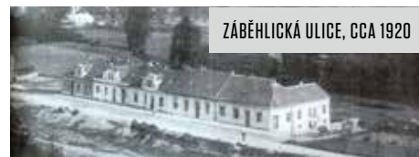
ZÁBĚHLICKÁ ULICE, CCA 1920

Máte doma historické fotografie nebo dokumenty, které se vztahují k Praze 10? Rádi si je od vás vypůjčíme, oskenujeme a v pořádku vrátíme nebo je rovnou přivítáme v elektronické podobě. Je možné, že se vaše cenná svědectví o historii Desítky následně objeví jako doprovod některých článků v příštích vydáních měsíčníku.