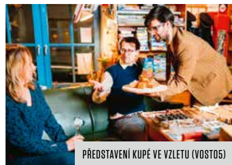
PŘEDSTAVENÍ KUPÉ VE VZLETU (VOSTO5)

Na 1. září je naplánováno oficiální otevření vršovické kulturní scény. Po dopoledním zahájení školního roku přijďte s dětmi na výtvarnou dílnu, hudební workshop a pohádky.