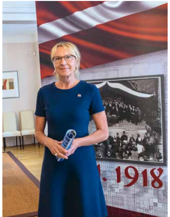
PANÍ GUNTA PASTORE, LOTYŠSKÁ VELVYSLANKYNĚ V ČESKÉ REPUBLICĚ

Letos v prosinci si připomeneme již stoletou tradici diplomatických vztahů mezi Českem a Lotyšskem. Při té příležitosti plánujeme hned několik akcí a venkovní výstavu, která se sice uskuteční někde v centru města, ale třeba bude možné ji později přesunout i na Desítku. Myslím, že máme co oslavovat, protože mezi oběma zeměmi panuje vřelé přátelství. Ukázala to i nedávná aféra kolem výbuchu ve Vrbě-