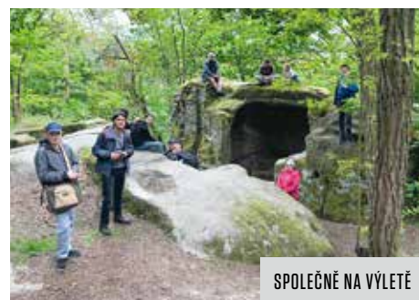
SPOLEČNĚ NA VÝLETĚ

Jako společenství křesťanů bychom chtěli i nadále přinášet a zvěstovat ve svém bezprostředním okolí radostnou zprávu o Boží lásce ke každému člověku. Vedle toho se také chceme zapojovat do veřejného a společenského života tam, kde působíme, tedy na Skalce a v jejím okolí. Jako křesťané vnímáme svůj díl odpověd-