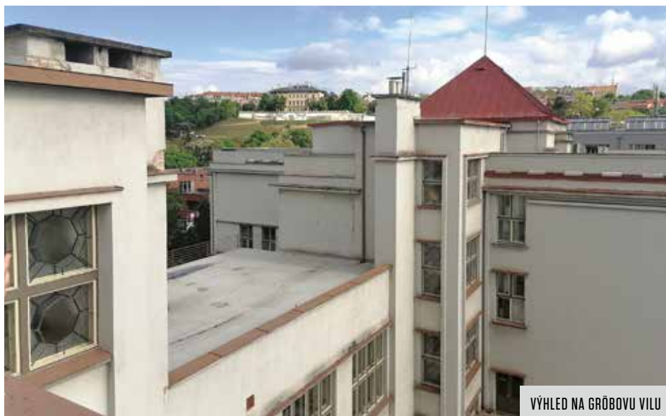
VÝHLED NA GRÖBOVU VILU

vé lavičky a veřejné pítko. Pro menší děti jsou zde také tři trampolínky zapuštěné do země, na kterých si často zahopsají i dospělí. Co víc si přát. Hezké místo nám tady Praha 10 připravila, děkujeme.