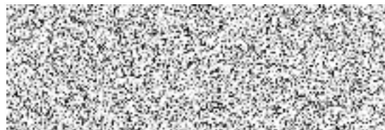
MgA. Olga Škochová ověřovatel zápisu