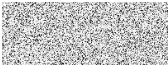
předseda Komise územního rozvoje RMČ P10