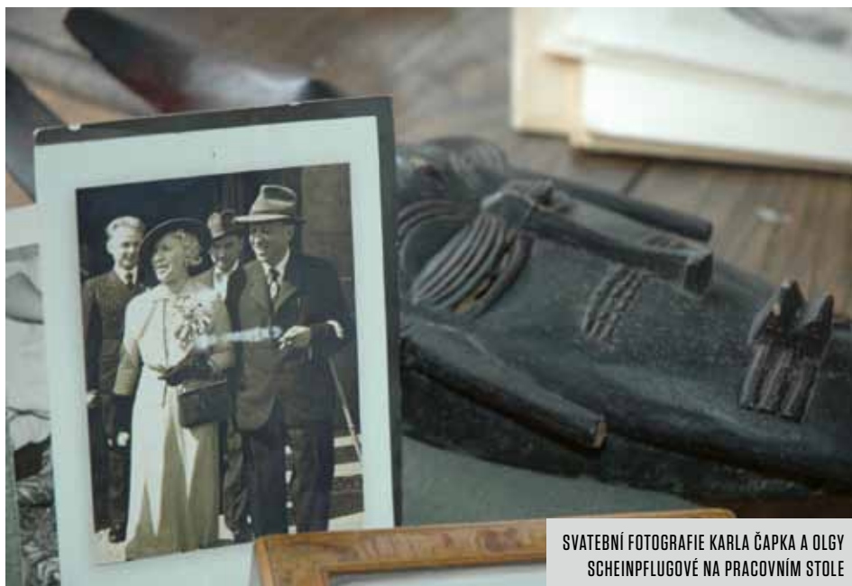
SVATEBNÍ FOTOGRAFIE KARLA ČAPKA A OLGY SCHEINPFLUGOVÉ NA PRACOVNÍM STOLE

Již na začátku roku 2018 byl vybrán dodavatel projektové dokumentace k obnově objektu. Dozorem nad její přípravou byla pověřena skupina nezávislých odborníků, kteří se průběžně setkávali s projektanty nad jednotlivými