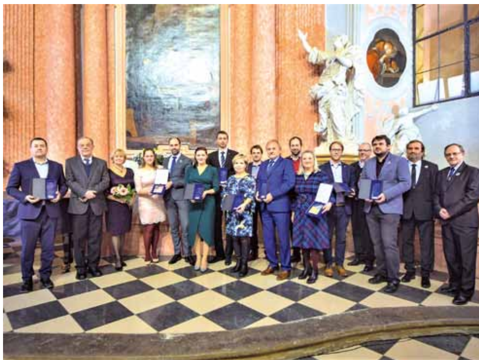
SPOLEČNÝ SNÍMEK DESETI OCEŇENÝCH MĚST ZA PŘÍKLADNÝ POSTUP V REALIZACI PROGRAMU ZDRAVÉ MĚSTO A MÍSTNÍ AGENDA 21.

V příštím čísle tohoto měsíčníku vás budeme informovat o našem prvním strategickém dokumentu. V něm si stanovíme cíle, kterých chceme v Praze 10 dosáhnout v dlouhodobějším horizontu deseti let. „Každoročně se budeme s vámi setkávat, abychom diskutovali plány rozvoje vždy v následujícím roce. Vize naší městské části zní: Desítkou je moderní, přátelská a otevřená městská část, která si zvolila udržitelný rozvoj, a na tom chceme společně s vámi spolupracovat,“ dodává starostka.