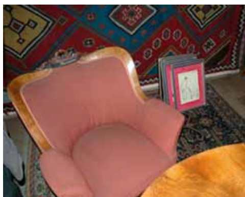
KŘESLO A PRACOVNÍ STŮL V ČAPKOVĚ PODKROVNÍ PRACOVNĚ

V současné době, kdy je možné hlavní přípravné práce považovat za ukončené, čeká městská část na vydání příslušného stavebního povolení. Na budoucího dodavatele stavebních prací se bude samozřejmě vztahovat stejně přísné posuzování jako v případě tvorby projektové dokumentace. Základním úkolem pro případné uchazeče ve výběrovém řízení tak bude, aby prokázali ověřitelným způsobem dostatečnou zkušenost v oblasti obnovy stavebně-historicky významných objektů, která bude muset být podpořena i souhlasem odborných pracovníků Národního památkového ústavu.