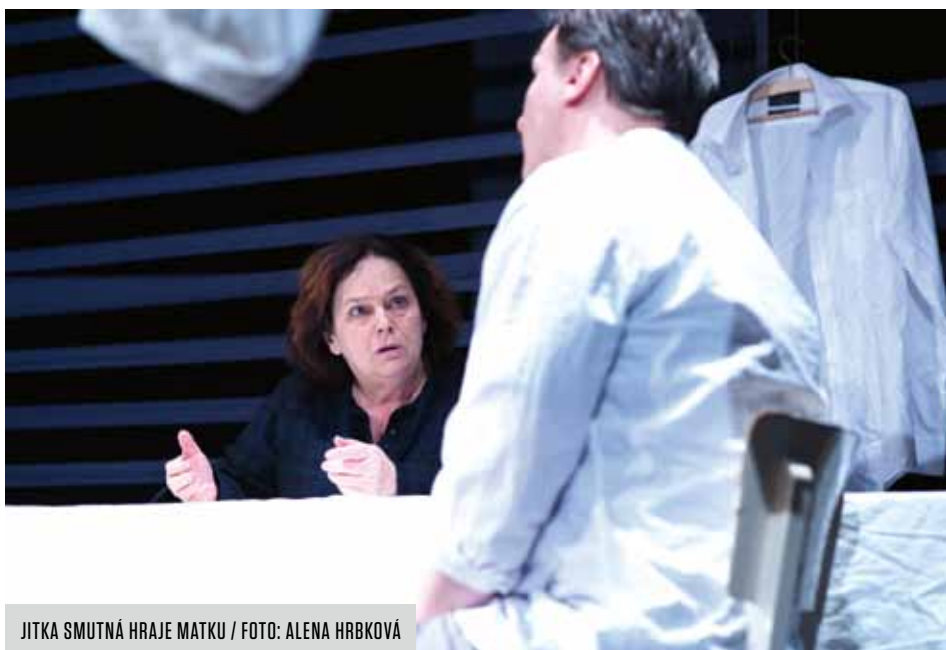
JITKA SMUTNÁ HRAJE MATKU / FOTO: ALENA HRBKOVÁ