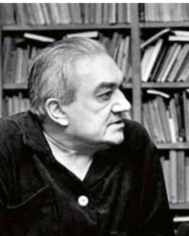
VLADIMÍR HOLAN NA SNÍMKU Z ROKU 1972