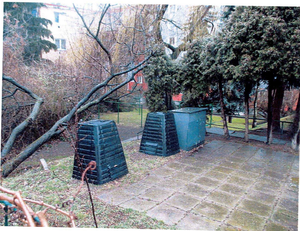
Vzrostlá zeleň na zbylé části pozemku