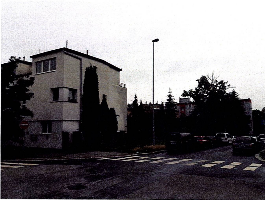
Pohled na zahradu nacházející se na parcelách 4060/3 a 4071/1