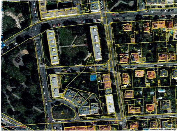
Pohled z křižovatky ulice Nad Olšinami a ulice Vilové směrem do Vilové