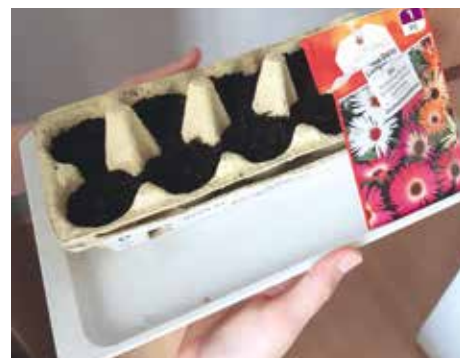
PLATO OD VAJIČEK JAKO KVĚTINÁČ PRO SEMÍNKA NA ZAHRADKU

Během června proběhlo sčítání získaných bodů. Kromě celkového skóre bylo pro konečné pořadí rozhodující i umístění žáka v rámci každého měsíce. Tím jsme zvýhodnili