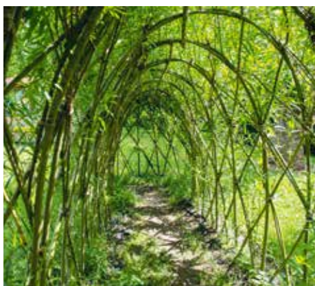
VRBOVÉ TYPY V MŠ U ROHÁČOVÝCH KASÁREN

A právě mateřské školy jsou v budování přírodních zahrad velmi aktivní. MŠ U Roháčových kasáren tu svou dokončila už v minulém roce, když se jí na projekt podařilo získat dotaci přesahující 300 tisíc korun. Děti jsou nadšené zejména z multifunkčního herního prvku s velkou klouzačkou, ptačí budkou, slunečními hodinami a vodní kladkou. Postupně se tady rozvíjejí také dvě typy spletená z vrbových prutů, která budou sloužit jako originální přírodní herny, a dobře se ujal i vysazený javor. Díky vyluzování zvuků z dendrofonu mohou děti zase poznávat rozdíly mezi jednotlivými druhy dřevin.