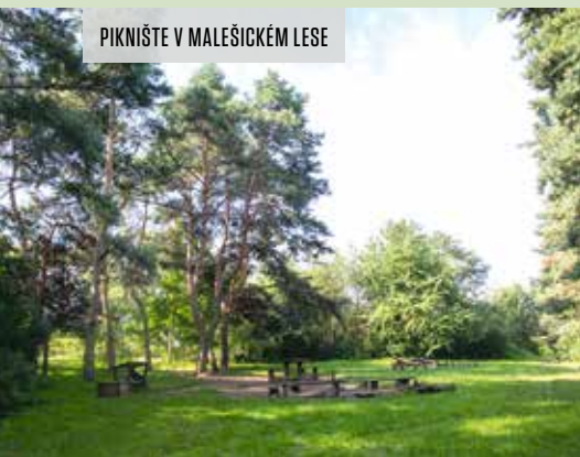
PIKNIŠTE V MALEŠICKÉM LESE