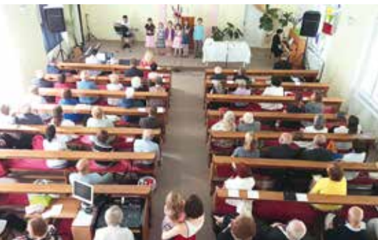
BOHOSLUŽBA NA KONCI ŠKOLNÍHO ROKU

Kořeny strašnického sboru Církve adventistů sedmého dne sahají až do roku 1948. Sbor tehdy vznikl jako součást bohosloveckého semináře Církve adventistů sedmého dne v Praze Krči. Obtížné časy čekaly naši církve po komunistickém převratu, kdy došlo k zákazu její činnosti. V roce 1952 jí byly zabaveny veškeré modlitebny a majetek. V této době až do roku 1956 se členové společně scházeli v domácích skupinkách. Navzdory nepříznivé situaci církev i nadále člensky a duchovně rostla.