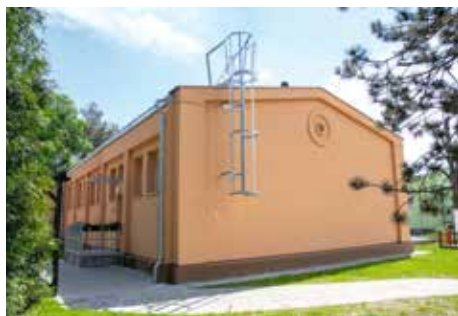
PAVILON MŠ U VRŠOVICKÉHO NÁDRAŽÍ

Investice do objektů, které využívají základní a mateřské školy zřizované radnicí, dosáhly v loňském roce 99 milionů korun. Radnice tyto prostředky vynaložila na jejich rekonstrukce a opravy a na přípravu budoucích projektů. Finanční výdaje vyplynuly z desetiletého plánu „Kompletní obnova materiálně technické základny MŠ a ZŠ“, podle něhož se radnice Prahy 10 v této oblasti řídí.