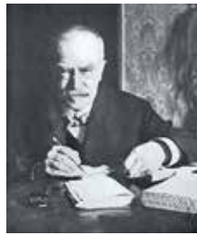
JAROSLAV GOLL (PŘED ROKEM 1926)

Byl tajemníkem amerického vyslance v Berlíně. Po návratu do Prahy učil na obchodní akademii, v roce 1875 se habilitoval na univerzitě a po jejím rozdělení v roce 1882 přešel jako profesor na českou část. Úřad rektora zde zastával v letech 1907–1908. Vybudoval základy pozitivistické dějepisné školy a vychoval řadu vynikajících historiků v čele s Josefem Pekařem. Spoluzakládal Český časopis historický a sám byl autorem důležitých odborných děl. Krátce působil jako redaktor Lumíra a věnoval se i psaní poezie. Jeho vnučkou byla populární herečka Nataša Gollová.