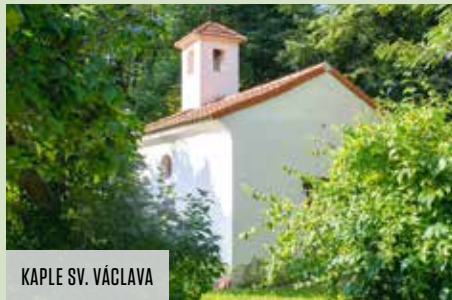
KAPLE SV. VÁCLAVA