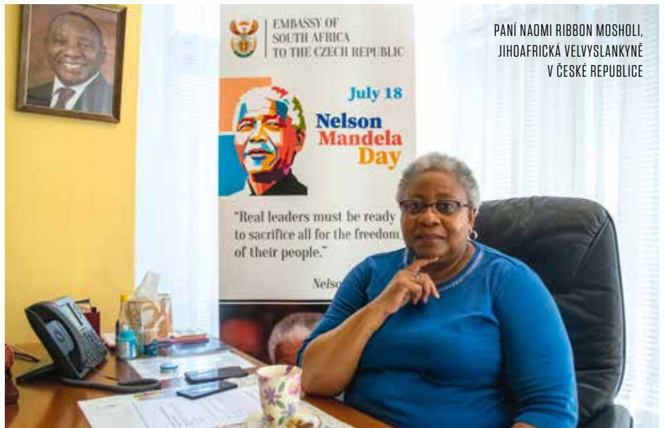
PANÍ NAOMI RIBBON MOSHOLI, JIHOAFRICKÁ VELVYSLANKYNĚ V ČESKÉ REPUBLICE

Co se týče umístění naší ambasády, po celou dobu sídlíme v pronájmu v této vile, navíc jen asi o tři domy dál máme i rezidenci. Pro nás je nejdůležitější otázka bezpečnosti. Před několika lety tady byly demonstrace, při kterých nám pomohla státní policie zajistit pořádek až do konce akcí. Tyto demonstrace se konaly kvůli údajnému útlaču bělochů v Jižní Africe a byly reakcí na pozemkovou reformu, kdy se naše vláda snažila zajistit výkup části farmářské půdy. Pozůstatkem apartheidu totiž zůstává fakt, že černí farmáři vlastní jen okolo 10 procent farmářské půdy. Nevýhodou