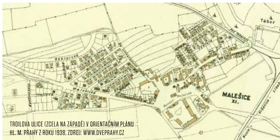
TROILOVA ULICE (ZGELA NA ZÁPADĚ) V ORIENTAČNÍM PLÁNU HL. M. PRAHY Z ROKU 1938

Ve Vršovicích se uskuteční jubilejní slavnost u příležitosti 90. výročí posvěcení kostela sv. Václava, která musela být loni na poslední chvíli odložena. Slavnostní průvod s koňmi a hudebními vystoupeními začne v 17.30 hod u kostela sv. Mikuláše na Vršovickém náměstí a vydá se Moskevskou ulicí ke kostelu sv. Václava. Na náměstí Svatopluka Čecha, kde se odehraje hlavní část programu, dorazí kolem 17.45 hod. Průvod pořádá farnost Vršovice za finanční podpory radnice Prahy 10.