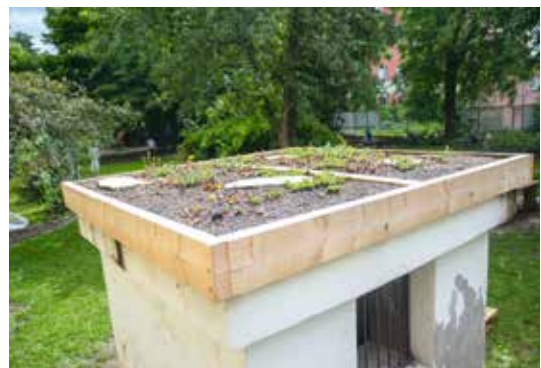
BYLINKOVÁ SPIRÁLA A ZELENÁ STŘECHA V ZAHRADĚ ZŠ EDEN