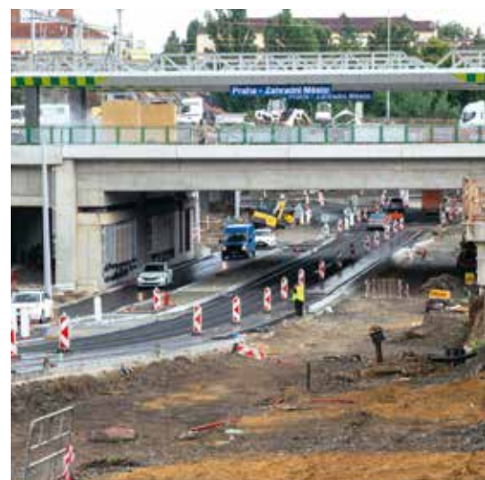
SITUACE NA STAVBĚ TERMINÁLU 23. 8. 2021

Na budoucích nástupištích již probíhají dokončovací práce, které směřují k úspěšnému zahájení provozu. Pod stanicí potom rychle vyrůstá integrovaná tramvajová a autobusová zastávka s přímým přístupem k vlakům. K dispozici tady bude také čekárna a odbavovací prostory. V prostoru za nedalekou čerpací stanicí pak vzniká nová tramvajová smyčka, kde bude napříště končit část spojů linky č. 22.