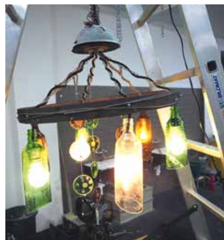
POUŽITÉ LAHVE JAKO STÍNÍTKA V LUSTRU

ty, kteří se snažili po celou dobu. Soutěže se zúčastnilo 291 školáků z prvního stupně a 144 z druhého stupně, což jsou téměř všichni žáci školy. Dohromady bylo uděleno 16 226 bodů. Pro nejlépe umístěné byly vyrobeny diplomy, ekologické lahvíčky na vodu s potiskem EVVO výzvy a pamětní plakety, proběhlo i vyhlášení vítězů školním rozhlasem a slavnostní předání cen. Kromě jednotlivců byly odměněny také nejuspěšnější třídy.