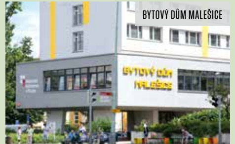
BYTOVÝ DŮM MALEŠICE