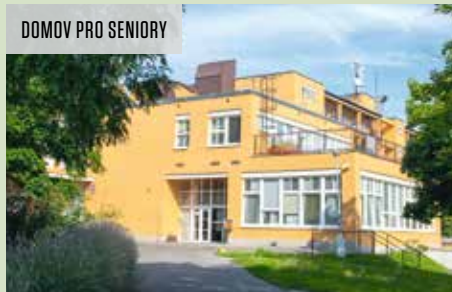
DŮMOV PRO SENIORY