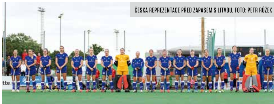
ČESKÁ REPREZENTACE PŘED ZÁPASEM S LITVOU

Aby se domácí výběr dostal do bojů o medaile, musel by soupeřky ze země galského kohouta porazit o čtyři góly. To byl prakticky nesplnitelný úkol, neboť Francouzky si do té doby vedly suverénně, porazily jak Bělorusko, tak i Rakousko. Do poslední čtvrtiny byl stav zápasu nerozhodný, ale osm minut před koncem Francie po rychlé akci strhla vítězství na svou stranu.