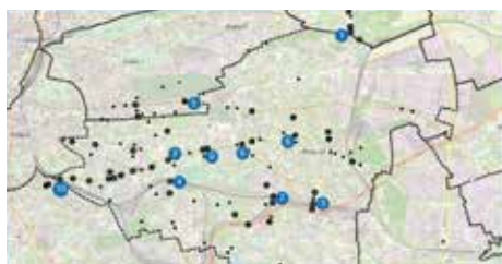
MAPA PROBLÉMOVÝCH MÍST

Prostředí v Praze 10 je z hlediska členitosti poměrně rozmanité, ale nabízí mnoho krásných míst, která přímo vybízejí k návštěvě na kole, na koloběžce nebo na jiném bezmotorovém prostředku. Když městskou částí projíždíte, určitě si všimáte, kde by si její cesty zasloužily vylepšení nebo kam by bylo dobré napnout síly pro zajištění větší bezpečnosti provozu.