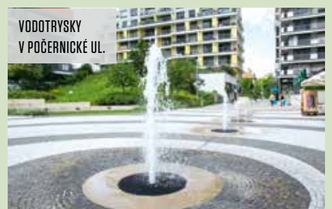
VODOTRYSKY V POČERNICKÉ UL.