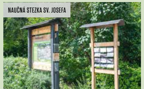
NAUČNÁ STEZKA SV. JOSEFA