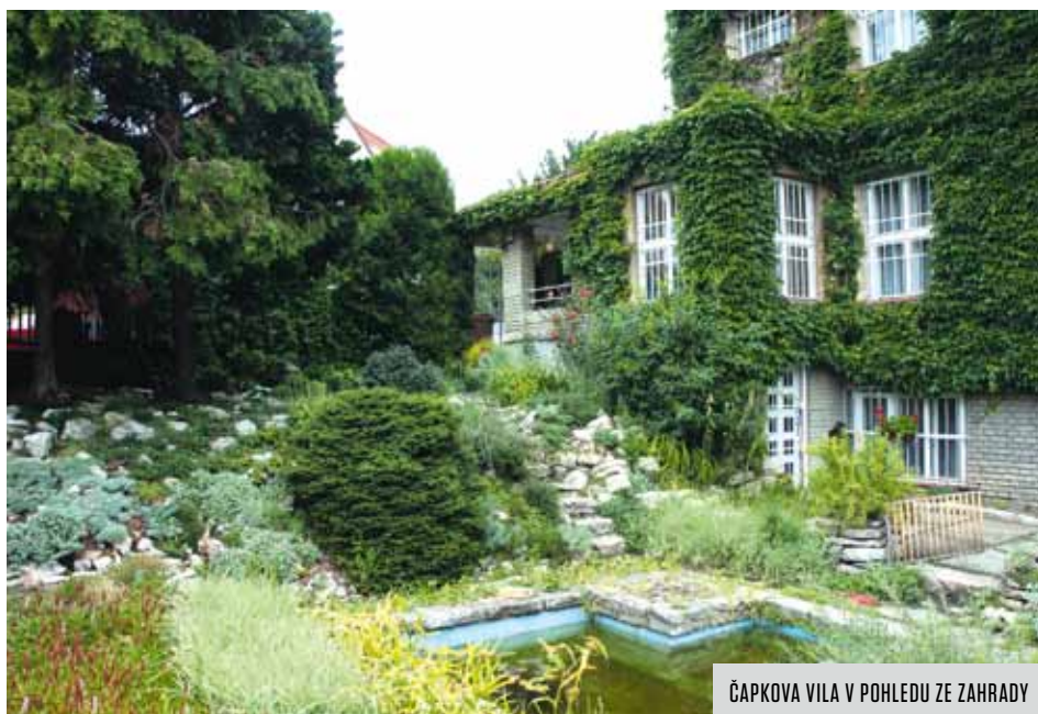
ČAPKOVA VILA V POHLEDU ZE ZAHRADY

Dům bratří Čapků v tehdejší Úzké ulici byl dokončen v roce 1924 podle projektu architekta Ladislava Machoně. Tento žák Jana Kotěry proslul jako autor mnoha zajímavých staveb v tzv. národním slohu a ve stylu moderny a funkcionalismu. Po smrti svého učitele například dokončil jeho projekt Právnické fakulty Univerzity Karlovy, stavěl také vilu pro sochaře Otakara Španiela na Ořechovce. Dům Čapkových se vzápětí stal svědkem bohatého a do značné míry dramatického života svých obyvatel, jejich houževnaté tvůrčí práce, mnohostranných zálib a četných setkání s přáteli a různými osobnostmi. Je všeobecně známo, že vila proslula schůzkami tzv. pátečníků, kdy sem pravidelně přicházeli diskutovat nejvýznamnější politici v čele s prezidentem Masarykem a největší literáti a novináři této