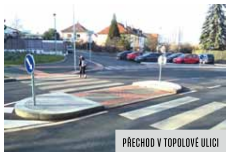
PŘECHOD V TOPOLOVÉ ULICI

Téměř čtvrtina dětí považuje svoji cestu do školy za nebezpečnou – postrádají možnost bezpečného přecházení, protože přechody buď zcela chybí, nebo jsou příliš dlouhé či nepřehledné. Cesty do školy mnohdy vedou temnými a neupravenými podchody nebo přes neudržované parky či veřejná prostranství, kde se děti bojí.