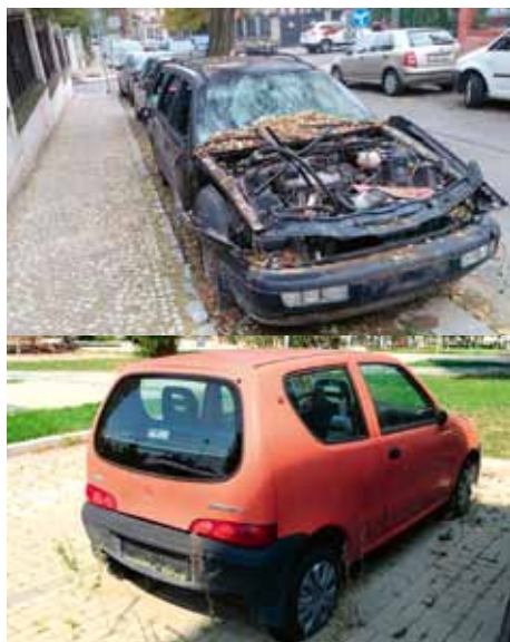
ROZDÍL MEZI VNÍMÁNÍM VRAKU NYNÍ A PO PŘIJETÍ NOVELY ZÁKONA.

Poslanci v parlamentu schválili novelu zákona o pozemních komunikacích, která umožní městům a obcím účinně odstraňovat ze svých komunikací dlouhodobě odstavená vozidla. Pro Prahu 10 to znamená, že se zahájením účinnosti zákona by na jejím území mohla začít přibývat parkovací místa obsazená nyní vraky. Odhadem by jich mohlo být až několik stovek. Změnu právního stavu iniciovala naše městská část a politicky ji prosazovala starostka a zároveň senátorka Renata Chmelová. Ve schválené novele jsou zapracované zkušenosti silničního správního úřadu Prahy 10 a zástupci radnice své připomínky vznášeli i při opakovaných jednáních na Ministerstvu dopravy.