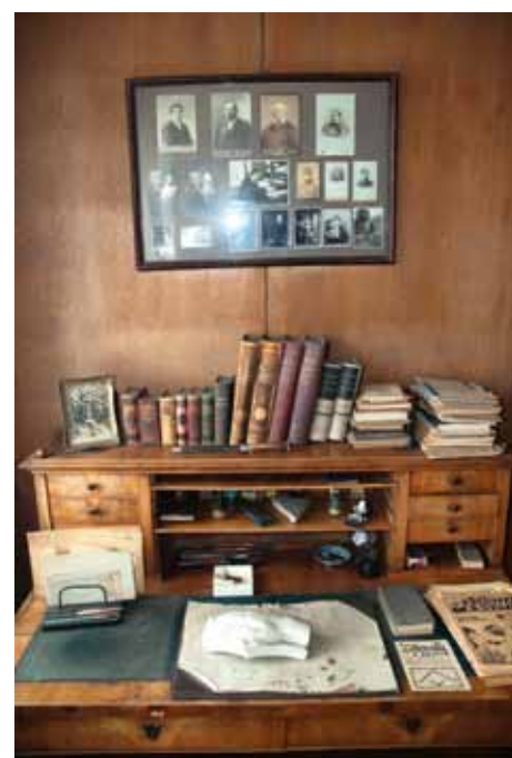
ČAPKŮV PRACOVNÍ STŮL JE NYNÍ V DEPOZITÁŘI

v kontextu celé české překladové literatury. Na stejném místě bude 13. května zahájena „Noc literatury,“ kterou pořádají Česká centra ve spolupráci s kulturními institucemi a ambasádami zemí EU. Podstatou projektu je přiblížit návštěvníkům evropskou literaturu, a to prostřednictvím veřejných čtení v přednesu známých herců na netradičních místech. V Praze 10 to bude čtení z Čapkova díla právě v prostorách jeho domu. Kromě zmíněných událostí s již potvrzenými termíny bude Čapkova vila v průběhu roku ještě několikrát otevřena v rámci komentovaných prohlídek, o nichž budeme informovat na stránkách www.praha10.cz . Určitě by sem měli zavítat lidé z Desítky, protože i když byl Karel Čapek spisovatelem a dramatikem světového dosahu, byl to zároveň náš soused.